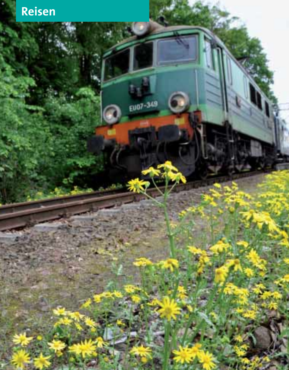
Das Reiseprogramm bietet zahlreiche Ziele an – zu erreichen per Schiff, Flugzeug, Bus oder mit dem Zug.