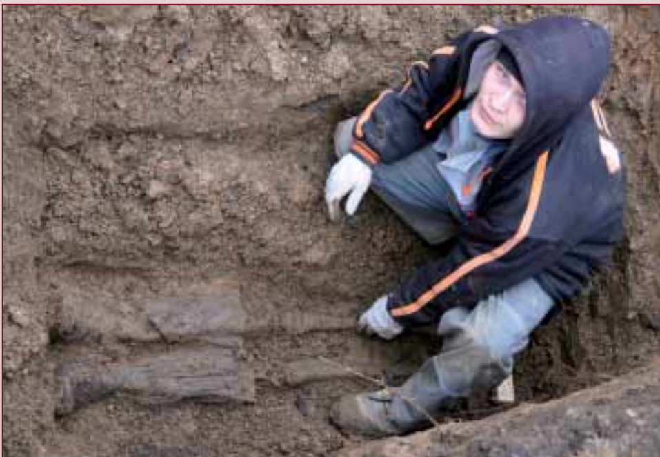
Die Toten, welche die Mitarbeiter des Volksbund-Umbettungsdienstes hier ausbetten, starben vor fast 70 Jahren in dem damaligen Wehrmachtslazarett bei Wjasma.

Ein am Ende positives Beispiel hierfür ist Rshew. Am 22. September 2012 erinnert der Volksbund daher auf diesem Soldatenfriedhof in direkter Nachbarschaft zu einer russischen und einer kasachi-