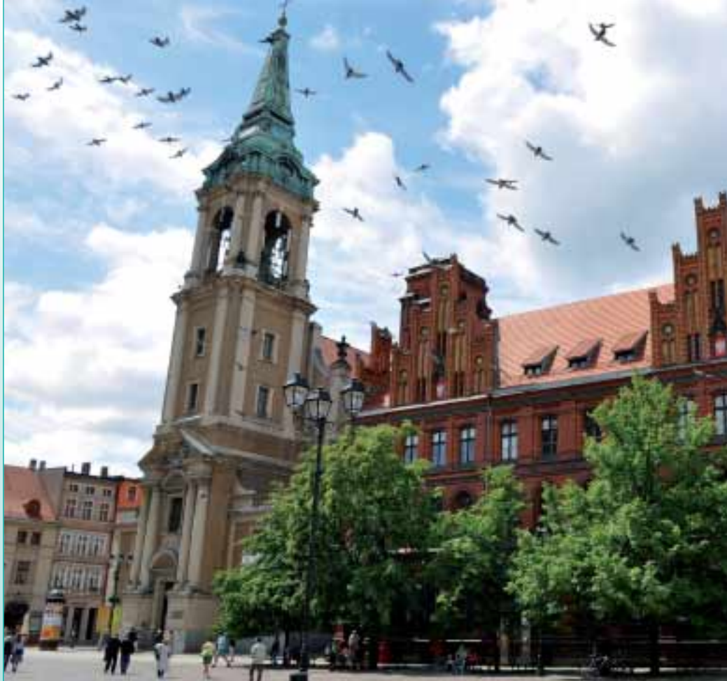
Auch das malerische Posen zählt zum Programm der Schienenkreuzfahrt Masuren und Ostpreußen.