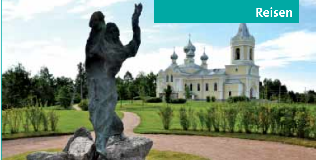
Das Foto zeigt die Kirche Mariä Himmelfahrt in Nachbarschaft der Kriegsgräberstätte Sologubowka.

2.-10.9.: Bus ab/bis München unter Leitung eines Militärhistorikers