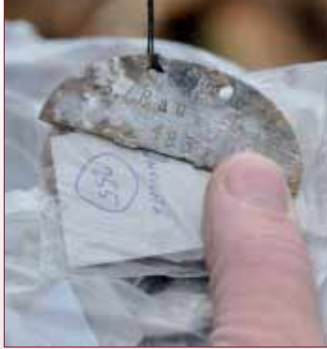
Erkennungsmarken wie diese sind der Schlüssel zur Identifizierung der Toten.