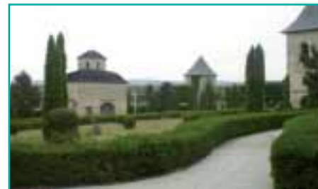
Das Cetățuia-Kloster in der Nähe der Stadt Iasi