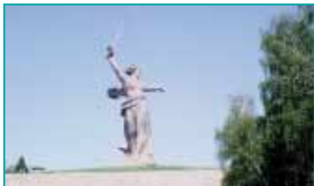
Mamajew-Hügel in Wolgograd