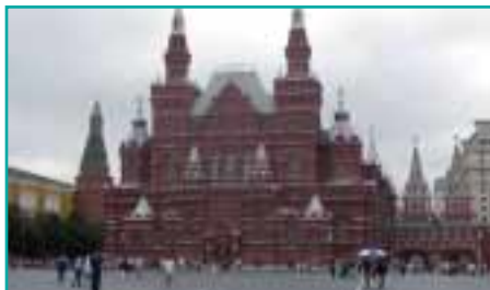
Das Historische Museum am Roten Platz in Moskau