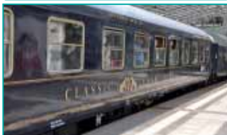
Mit dem „Classic Courier“ geht es nostalgisch von Berlin nach Königsberg (Kaliningrad)