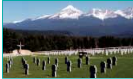
Važec, Soldatenfriedhof an der Hohen Tatra