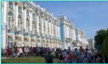
Die Eremitage in St. Petersburg