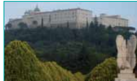
Blick vom polnischen Soldatenfriedhof auf das wiedererrichtete Kloster Monte Cassino