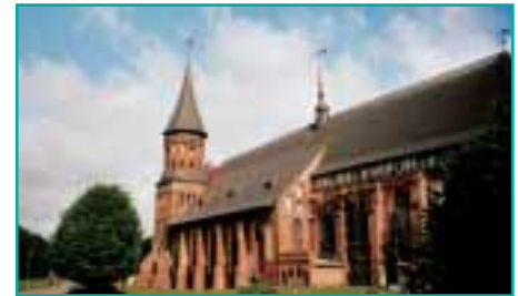
Der wiedererrichtete Dom in Königsberg (Kaliningrad)