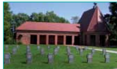
Andilly - größte deutsche Kriegsgräberstätte des Zweiten Weltkrieges in Frankreich