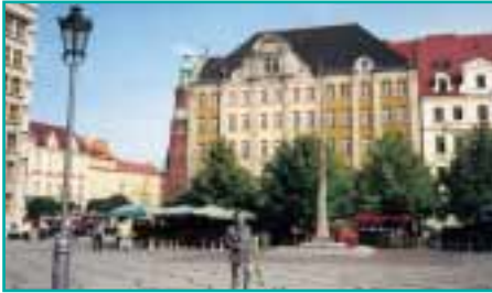
Die wieder errichtete Altstadt Breslaus, der alten Hauptstadt Schlesiens