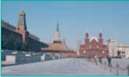
Moskau – Der Rote Platz mit Kreml