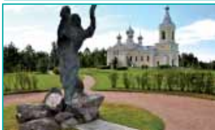
Die Kirche Mariä Himmelfahrt neben der deutschen Kriegsgräberstätte Sologubowka