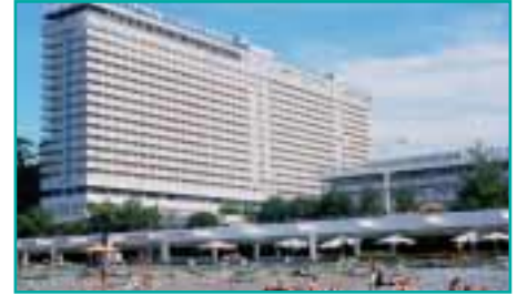
Die Schwarzmeerstadt Sotschi ist Austragungsort der Olympischen Winterspiele 2014