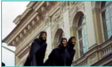
Künstler vor dem Schauspielhaus in Vilnius