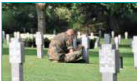
Die Friedhöfe in der Normandie (hier Orglandes) bestehen nun schon 50 Jahre.