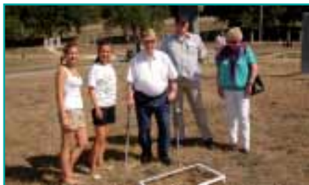
Kriegsgräberstätte Sewastopol-Gontscharnoje – 10. Jahrestag der Einweihung