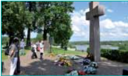
Der Friedhof Narva am namensgebenden Grenzfluss zu Russland