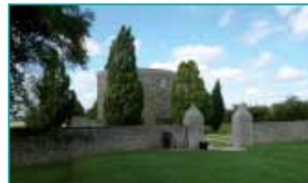
Die an der Somme gelegene deutsche Kriegsgräberstätte Bourdon