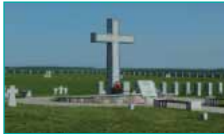
Der im Jahre 2009 eingeweihte deutsche Soldatenfriedhof Besedino bei Kursk