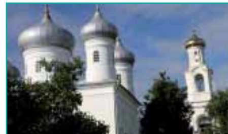
Die im Jahr 1043 erbaute Kirche St. Sophia in Nowgorod, das älteste Steingebäude Russlands