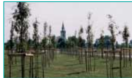
Friedenspark in Groß Nädliitz (Nadolice Wielkie)