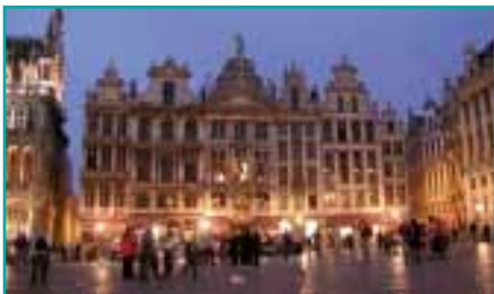
Der allabendlich erleuchtete Marktplatz in Brüssel lädt zum Verweilen ein.