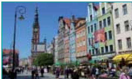
Die wiedererrichteten Fassaden der Danziger Altstadt laden zum Bummeln ein.