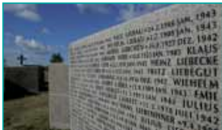
Namenwürfel für Vermisste und nicht zu bergende Tote in Rossoschka