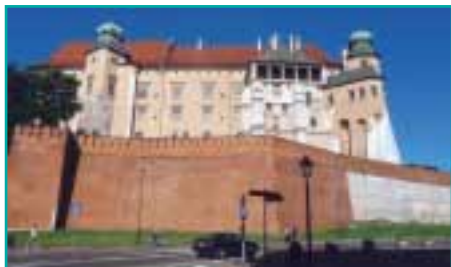
Die alte polnische Königsburg Wawel – Weltkulturerbe in der Stadt Krakau