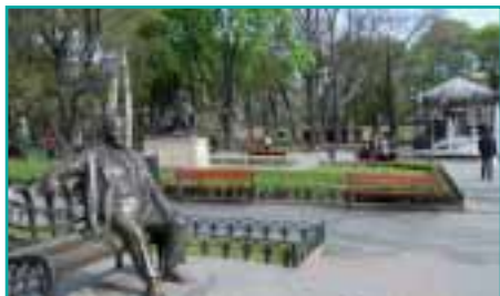
Denkmal Leonid Utjosows, des berühmten Schauspielers, im Stadtgarten Odessas