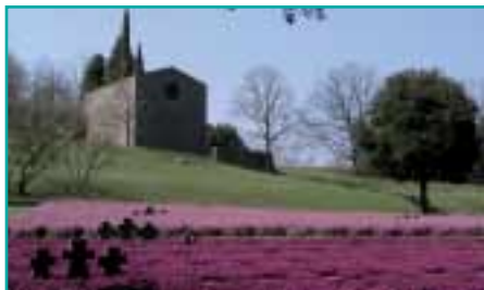
Friedhof Costermano, oberhalb des Gardasees