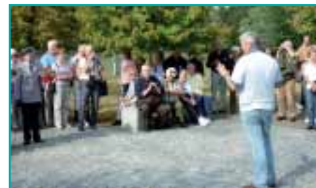
Besuch auf der Kriegsgräberstätte Kiew