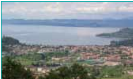
Der Gardasee vom Friedhof Costermano aus gesehen