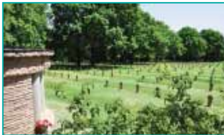
Blick auf die deutsche Kriegsgräberstätte St. Désir-de-Lisieux