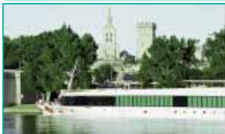
Auf der Rhône vorbei an Avignon