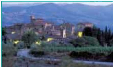
Malerische Abendstimmung in der Toscana