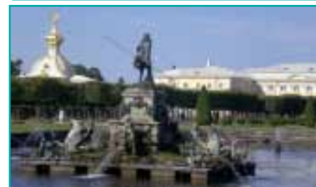
Der Petersburger Neptunbrunnen