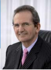
Hermann Dinkla Präsident des Niedersächsischen Landtages Schirmherr des Landesverbandes Niedersachsen

Als Präsident des Niedersächsischen Landtages fühle ich mich in einem weiter zusammenwachsenden Europa der im Dienste der Völkerverständigung stehenden Arbeit des Volksbundes Deutsche Kriegsgräberfürsorge, die zum großen Teil ehrenamtlich geleistet wird, ganz besonders verbunden.