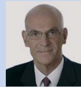
Heiner Bartling Landtagsabgeordneter, SPD Innenminister a.D.

Der Volksbund finanziert sich zu 90 % aus Spendengeldern und erhält nur 10 % aus dem Bundeshaushalt. Deshalb versucht er durch verschiedene Veranstaltungen für seine Arbeit und sein Anliegen zu werben. Musikveranstaltungen, Informationsangebote, Filmvorführungen, Reiseangebote zu den Kriegsgräberstätten, Gedenkfeiern u. ä. gehören zu den Aktivitäten des Volksbundes.