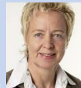
Ina Korter Landtagsabgeordnete, Bündnis 90/Die Grünen

(Beschluss der Kultusministerkonferenz vom 22.03.1968 i. d. Fassung v. 27.04.2006, Auszug)