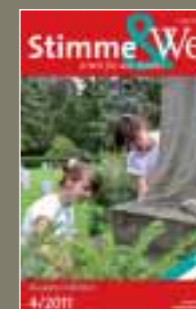
Theo Zwanziger, Aktion Rote Hand, 50 Jahre Orglandes, Workcamp 2011

Die ersten Granitwürfel mit den Namen der Vermissten von Stalingrad werden in Rossoschka installiert, ebenso die Tafeln der Ketschendorf-Opfer in Halbe. Bundespräsident Köhler übernimmt die Schirmherrschaft über den Volksbund. Kerzenaktion im niederländischen Ysselsteyn.