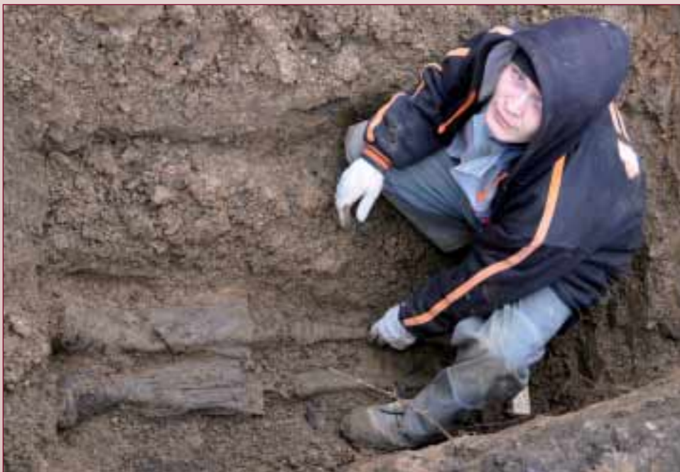
Die Toten, welche die Mitarbeiter des Volksbund-Umbettungsdienstes hier ausbetten, starben vor fast 70 Jahren in dem damaligen Wehrmachtslazarett bei Wjasma.