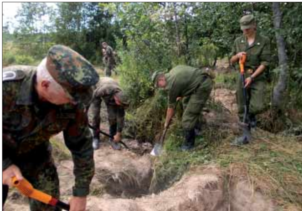
Am Ziel: Hier bergen deutsche und russische Soldaten die Gebeine bisher unbekannter Weltkriegsopfer in der Nähe von Glubotschka.