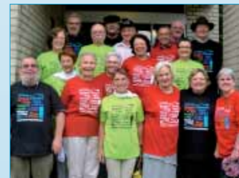
Großes Wiedersehen nach 50 Jahren: die Teilnehmer der ersten Stunde.