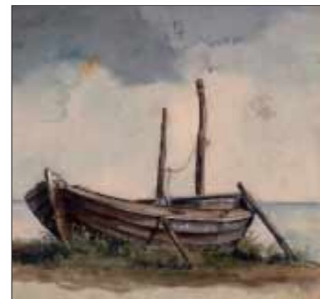
Peter Krentler: „Fischerkahn“, Aquarell ohne Jahresangabe, Privatbesitz

zember 1939. Wenig später brach die hoffnungsvolle künstlerische Karriere von Peter Krentler ab. Der Zweite Weltkrieg vernichtete ein hoffnungsvolles junges Talent. Bis zum 18. März (Dienstag bis Sonntag, 11 bis 16 Uhr) ist nun eine Auswahl seiner Werke im Museum Neustrelitz in der Schloßstraße 3 zu sehen.