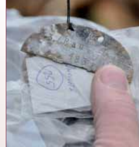
Erkennungsmarken wie diese sind der Schlüssel zur Identifizierung der Toten.