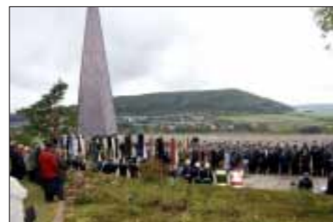
50 Jahre Kriegsgräberstätte Teuchtlingen: Gedenken an über 2 500 Tote.

erinnerten dabei daran, wie wichtig solche Gedenkort als „Prediger des Friedens“ sind und stellten zudem einige Einzelschicksale der hier Bestatteten vor.