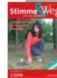
40-jähriges Bestehen der Kriegsgräberstätte Berneuil