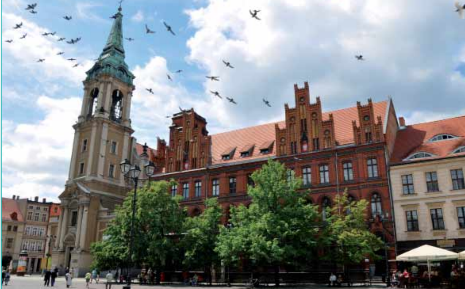
Auch das malerische Posen zählt zum Programm der Schienenkreuzfahrt Masuren und Ostpreußen.