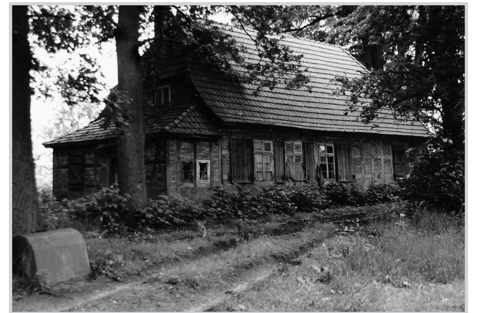
Häuslingshaus Riekenbostel Nr. 8, 1992.