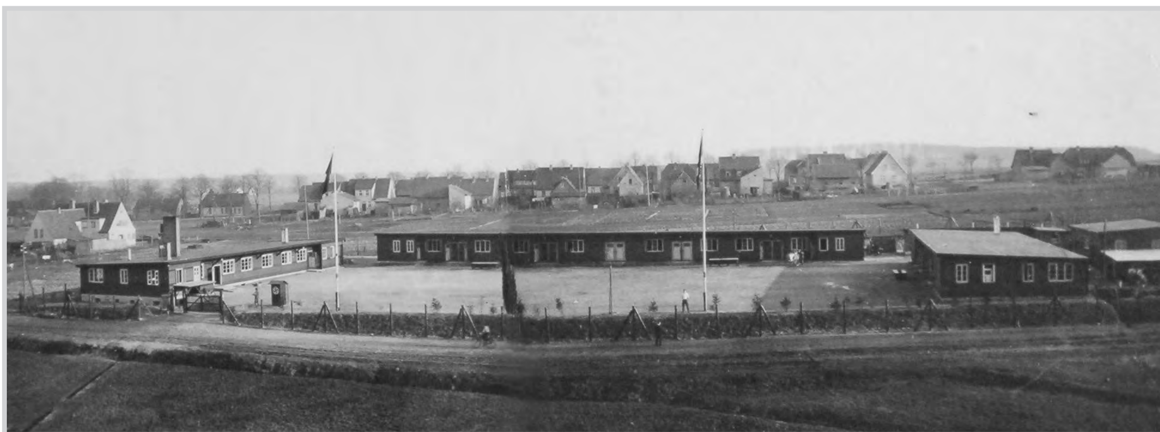
Das „Hermann-Löns-Lager“ am Alten Postweg in Walsrode wurde 1934 als Lager des Reichsarbeitsdienstes (RAD) eingerichtet. Während des Krieges diente es als Unterkunft für sog. „Fremdarbeiter“.

Von 1939-1945 wurden in Deutschland insgesamt ca. 9,5-10 Millionen Menschen als Zwangsarbeiter eingesetzt, davon war ein Drittel weiblich.