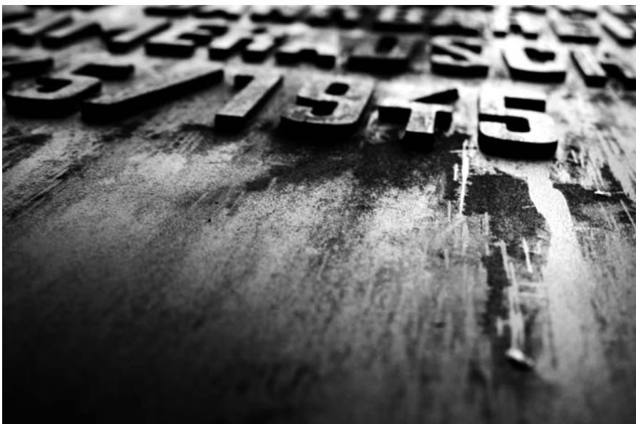
▲ Projekt „Nekropole Berlin: Neukölln 1945“ Eine Kooperation von Masterklassen der Beuth Hochschule für Technik Berlin mit dem Volksbund Deutsche Kriegsgräberfürsorge e. V. Landesverband Berlin Foto: Friedhof Lilienthalstraße