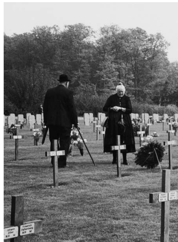
◀ Einweihung der Kriegsgräberstätte Niederbronn am 1. Oktober 1966

Er macht mich glücklich, weil ich sehr gerne jeden Tag zur Arbeit fahre. Manche verstehen nicht, wie man an einem Ort der Trauer auch Zufriedenheit erfahren kann. Aber ich glaube, das