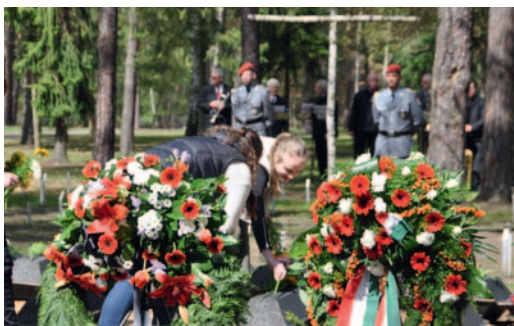
▲▲ Inszenierung von Volker Schlöndorff mit deutschen und französischen Jugendlichen zum 100. Jahrestages der Schlacht von Verdun, 29. Mai 2016