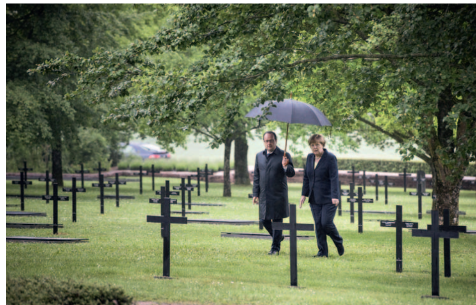
▲ Bundeskanzlerin Angela Merkel im Gespräch mit François Hollande, Präsident Frankreichs, auf dem deutschen Soldatenfriedhof anlässlich des 100. Jahrestages der Schlacht von Verdun, 29. Mai 2016

Dicht sind die Abstände, fast nicht auszuhalten. Der Wehenschreiber, an dem die ganze Welt liegt, kommt beinahe nicht hinterher mit den Aufzeichnungen. Im vergangenen Jahrhundert waren die Ausschläge nach oben noch deutlicher abgegrenzt. Der Erste Weltkrieg war vor einhundert Jahren auf