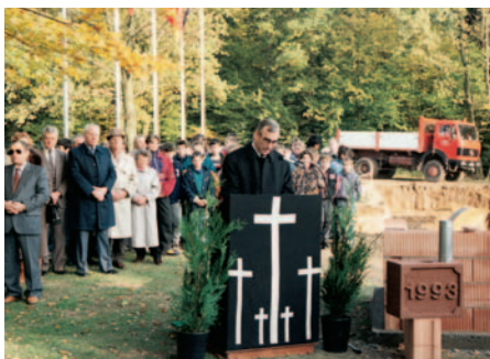
▲▲ Kriegsgräberstätte in Niederbronn-les-Bains, Eingang