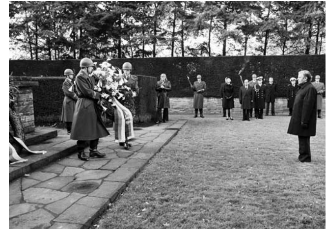
▶ Bundeskanzler Helmut Schmidt (r.) legt am Volkstrauertag auf dem Bonner Nordfriedhof einen Kranz nieder. 17. November 1974

Die Nationalsozialisten schrieben diese Deutung 1934 per Gesetz fest: Der Volkstrauertag wurde auf den 16. März gelegt und zum staatlichen „Heldengedenktag“ erklärt. Er sollte alle Deutschen in der Trauer vereinen. Aber alle, die aus politischen oder sogenannten rassistischen Gründen nicht zur „NS-Volksgemeinschaft“ zählten, wurden aus dem Gedenken herausgelöst – z. B. die gefallenen jüdischen Weltkriegssoldaten. An dieser Propaganda beteiligte sich auch der seit 1933 bereitwillig gleichgeschaltete Volksbund.