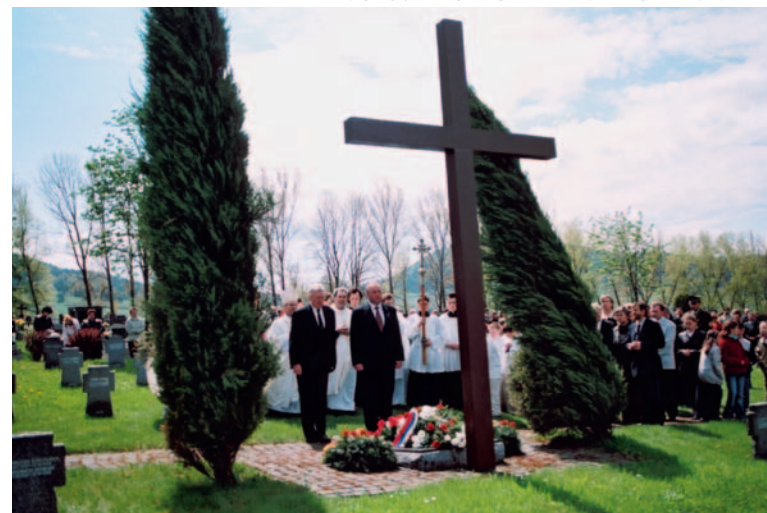
▲ Friedhof Zborov/Slowakische Republik, Gedenkfeier am 07. Mai 2005, 60 Jahre nach Kriegsende

Und wir erinnern uns auch an die deutschen Soldaten, die in diesem Krieg starben. Viele von ihnen waren persönlich unschuldig und doch schuldhaft eingebunden – wie die Deutschen insgesamt – in den Krieg und in die NS-Diktatur. Aber ob sie selbst schuldig oder unschuldig, oder ob sie, wie die meisten Menschen, auf einer der vielen Graustufen zwischen Schuld und Unschuld standen – auch