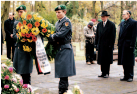
▲▲ Volkstrauertag auf dem Friedhof Ysselsteyn, Niederlande, 1986