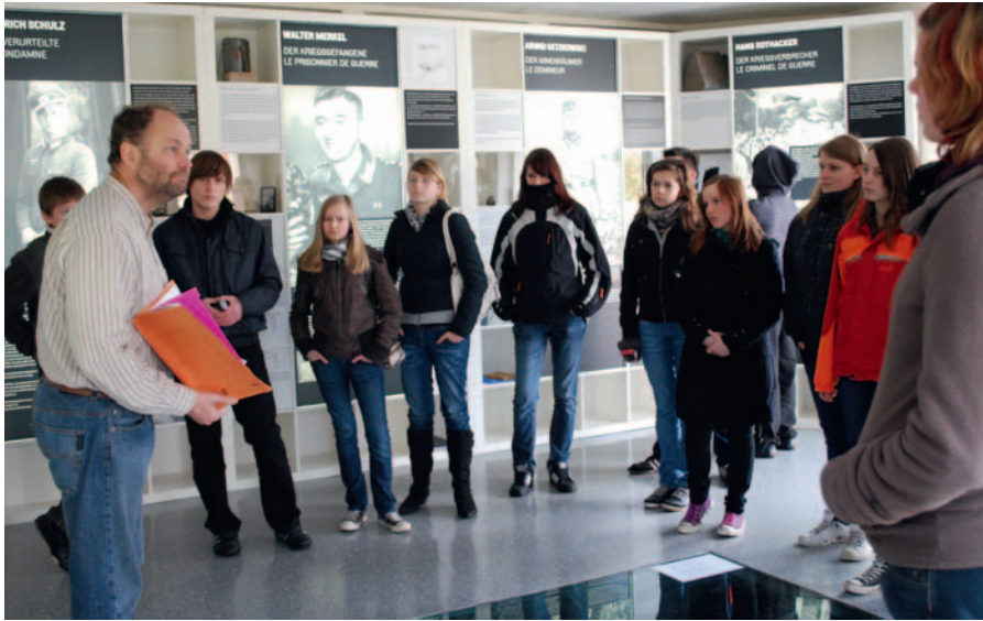
Einblick in die Dauerausstellung „Kriegsschicksale/Destins de Guerre“