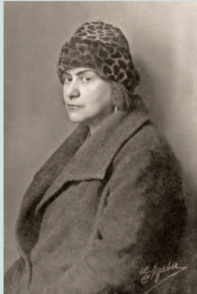
▶ Foto von Else Lasker-Schüler an ihrem 50. Geburtstag

dem Satz: „Es wird schon noch einen [Krieg] geben.“ „Ja“, ruft er begeistert, „trinken wir drauf!“ Aber wie viele ließ der gute Zufall im Stich? Sie verzweifelten wie Walter Benjamin 1940 in den Pyrenäen. Er hatte nur eine Tasche dabei, vielleicht voller Manuskripte, nicht einmal einen Rucksack, der als Erkennungsmerkmal für Deutsche galt. Als man ihm in Portbou sagte, ohne französisches Ausreisevisum könne er nicht nach Spanien – vielleicht nur ein Erpressungsversuch eines korrupten Grenzers, der eine Bestechung für eine Visumserteilung erwartete –, vergiftete Walter Benjamin sich. Und wie viele zerbrachen noch Jahre nach der Flucht am Exil wie Ernst Toller, der sich in seinem Hotel in New York erhängte? Oder Stefan Zweig, der in Brasilien die Zerstörung seiner „geistigen Heimat“ in Europa nicht aushielt und zusammen mit seiner Frau Lotte Suizid beging. Andere starben kurz nach der Flucht, entkräftet wie der Sänger Joseph Schmidt, der – endlich im Exil in der Schweiz – zusammenbrach und in ein Internierungslager gesteckt wurde, wo man seine Herzbeschwerden nicht