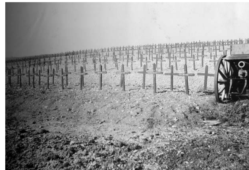
Deutsche Kriegsgräberstätte Consenvoye (Frankreich), um 1926

Wer sich so erinnern kann, hat viel von der Botschaft des Volkstrauertages verstanden. Seine Mahnung, Jahr um Jahr zurückzublicken, ist kein Glasperlenspiel: Wir gedenken der Toten auch, um die Lebenden nicht zu vergessen. Es geht nicht allein um das Gestern, sondern genauso um das Heute und das Morgen.