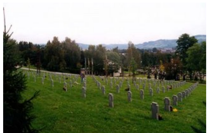
Deutsche Kriegsgräberstätte 1939/45 Valašské Meziříčí / Walachisch Meseritz