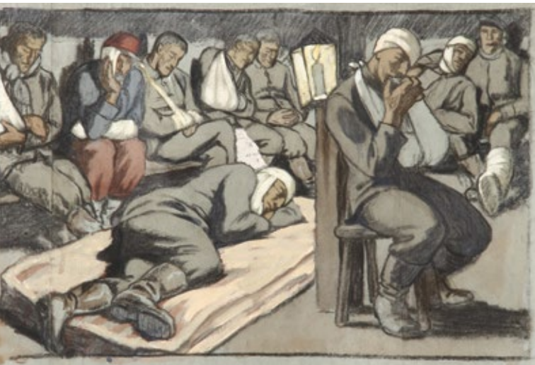
Walter Georgi: Verwundetentransport (Bayerisches Armeemuseum)

Spätsommer 1914. Bereits zu Beginn des Ersten Weltkrieges kam es zu verlustreichen Kämpfen insbesondere an der Westfront (Lothringen, Vogesen, Marne, Ypern), aber auch an der Ostfront (Ostpreußen, Galizien). Die Verluste beliefen sich für das deutsche Feldheer auf 142.000 Gefallene und 540.000 Verwundete, mehr als dreimal so viel wie während des gesamten Krieges 1870/71.