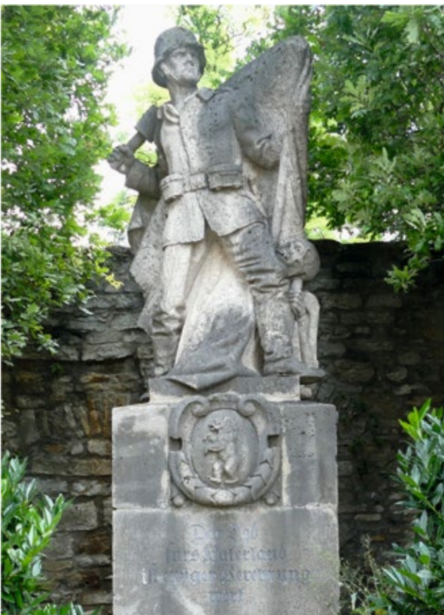
Pathetische Darstellung am Denkmal in Mainbernheim

Als künstlerisch bemerkenswert gilt das Denkmal in Mainbernheim, das einen zum Handgranatenwurf ausholenden Soldaten zeigt. Aus einem mantelartigen Überwurf, blickt ein Skelett hervor. Der Text „Der Tod fürs Vaterland ist ewiger Verehrung wert“ entsprach zum Zeitpunkt der Errichtung (1927) der damals vorherrschenden Gesinnung.