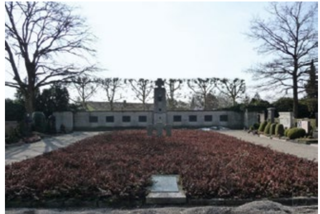
In einem Gräberfeld ruhen 336 deutsche Lazaretttote des Ersten Weltkrieges.