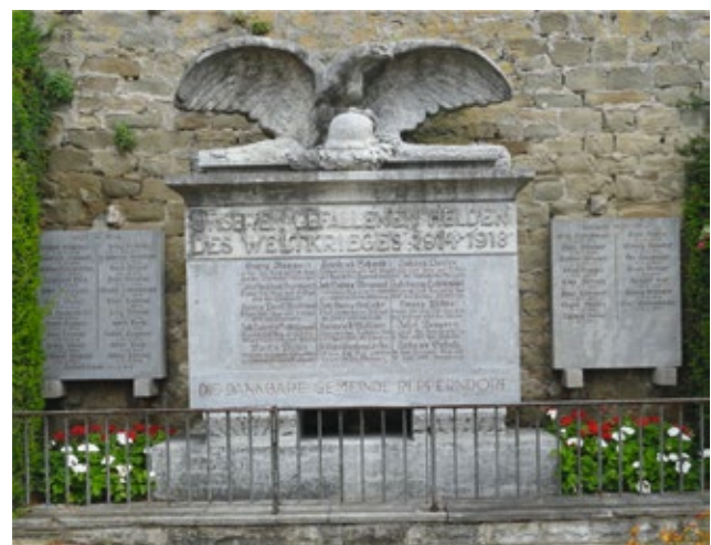
Adlerschwingen sollten Stärke und Schutz symbolisieren

Im Stadtteil Repperndorf wird das Namensverzeichnis von einem überdimensionalen Adler geziert, der mit ausbreiteten Flügeln auf einem Stahlhelm und einem Lorbeerkrans sitzt, so, als ob er den Gefallenen noch im Tode Schutz gewähren wollte.