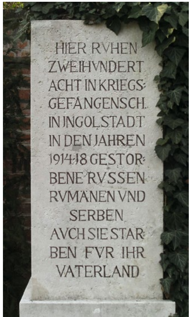
Unweit davon finden wir die letzte Ruhestätte von 208 unbekanntem ausländischen Soldaten des Ersten Weltkrieges, überwiegend osteuropäische Kriegsgefangene.