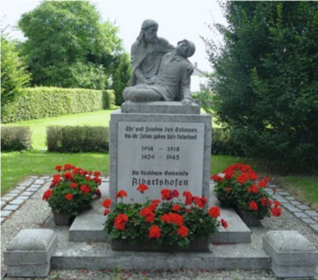
Gottes Sohn nimmt sich des sterbenden Soldaten an

Als künstlerisch bemerkenswert gilt das Denkmal in Mainbernheim, das einen zum Handgranatenwurf ausholenden Soldaten zeigt. Aus einem mantelartigen Überwurf, blickt ein Skelett hervor. Der Text „Der Tod fürs Vaterland ist ewiger Verehrung wert“ entsprach zum Zeitpunkt der Errichtung (1927) der damals vorherrschenden Gesinnung.