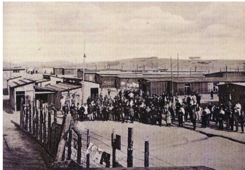
Das Gefangenenlager Kümmersbruck

Problematisch war die Versorgungslage der Gefangenen, die zwar Anspruch auf angemessene Verpflegung und Kleidung hatten, aber wie die deutsche Bevölkerung insgesamt zunehmend von den blockadebedingten Versorgungsengpässen betroffen waren. Dementsprechend stieg in den Gefangenenlagern die Todesrate aufgrund von Mangelernährung und Krankheiten. Ein gewisses Maß an Schutz und Unterstützung bot das Internationale Rote Kreuz durch die Inspektion von Lagern sowie die Organisation von Briefkontakten und Hilfssendungen. Nach dem Waffenstillstand am 11. November 1918 vollzog sich die Rückführung in die jeweiligen Heimatländer zu unterschiedlichen Zeitpunkten, dauerte aber bei der Rückkehr deutscher Kriegsgefangener aus Russland bis 1922.