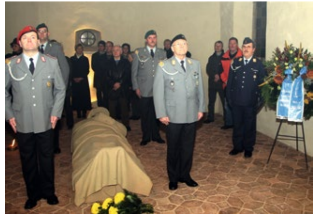
Gedenkkultur: Der Landkreis Kitzingen erinnert am Volkstrauertag in der Kreiskriegergedenkstätte Marktbreit an seine Gefallenen und Vermissten

Eine Besonderheit ist die Kreiskriegergedenkstätte über den Dächern von Marktbreit, untergebracht in einer ehemaligen Kapelle. Hier erfolgt alljährlich am Volkstrauertag eine Kranzniederlegung durch den Landkreis, die von der Bevölkerung gut angenommen wird. In besonderen Gedenkjahren gestalten und umrahmen Reservisten aus den kreisangehörigen Gemeinden die Zeremonie.