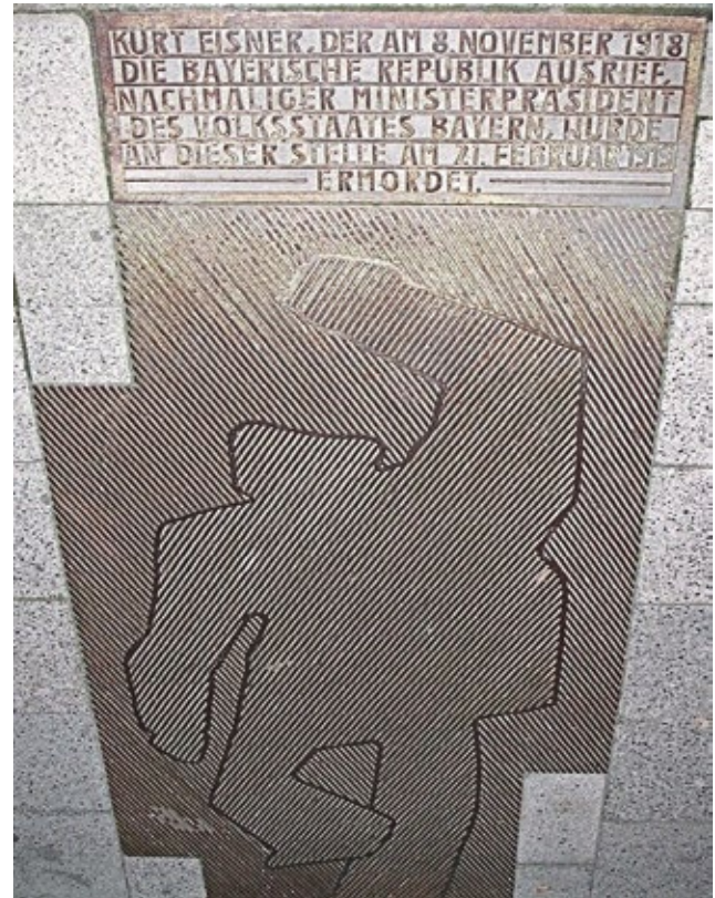
Bodendenkmal in der Kardinal-Faulhaber-Straße in München, eingeweiht 1989: Es zeigt den Umriss des ermordeten Eisner am Tatort.