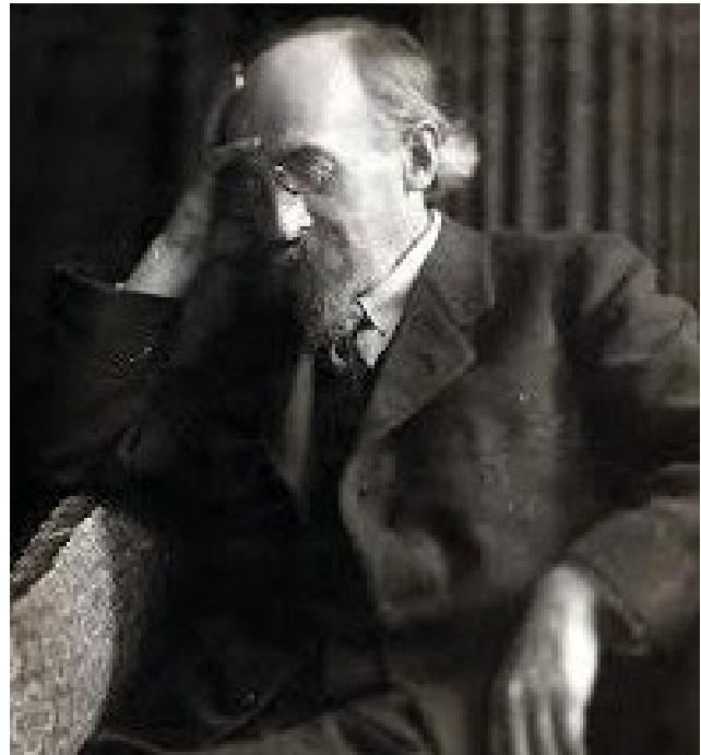
Kurt Eisner

Der Aufruf Eisners in der Nacht vom 7. auf den 8. November kündigte baldige Wahlen an, denn sein Ziel war die Errichtung einer Demokratie. Bis zu den Wahlen einer Nationalversammlung sollte ein Provisorischer Nationalrat die In-