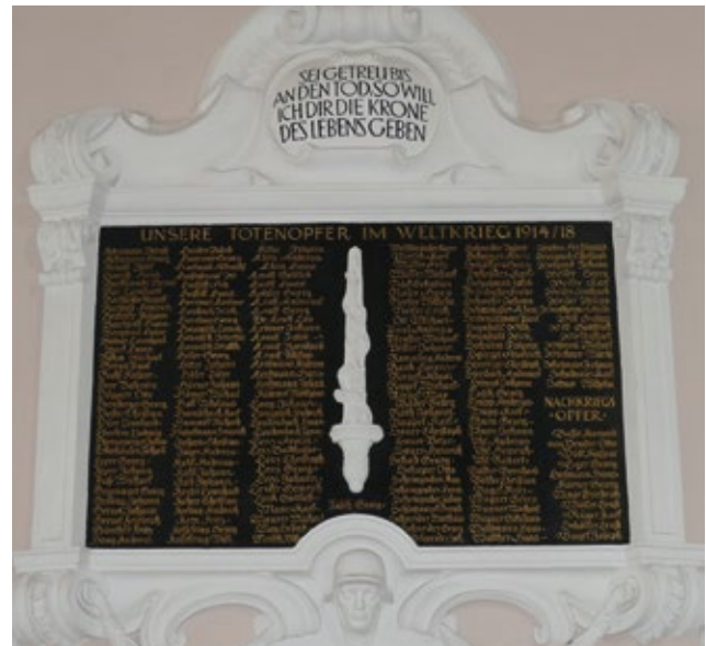
Kriegerdenkmal im Innenraum der Kirche

mor sind über dem Zugang zur Sakristei in goldenen Lettern die Namen von 187 Kriegstoten verzeichnet. Darüber in einem Medaillon die Inschrift „Sei getreu bis an den Tod, so will ich Dir die Krone des Lebens geben.“ (Offenbarung des Johannes 2,10). Ein mit Blüten umranktes Schwert teilt die Namensliste, unter der ein behelmter Soldatenkopf herausragt.