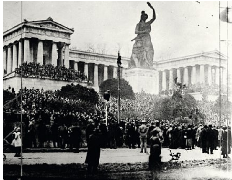
Demonstration auf der Theresienwiese am 7.11.1918