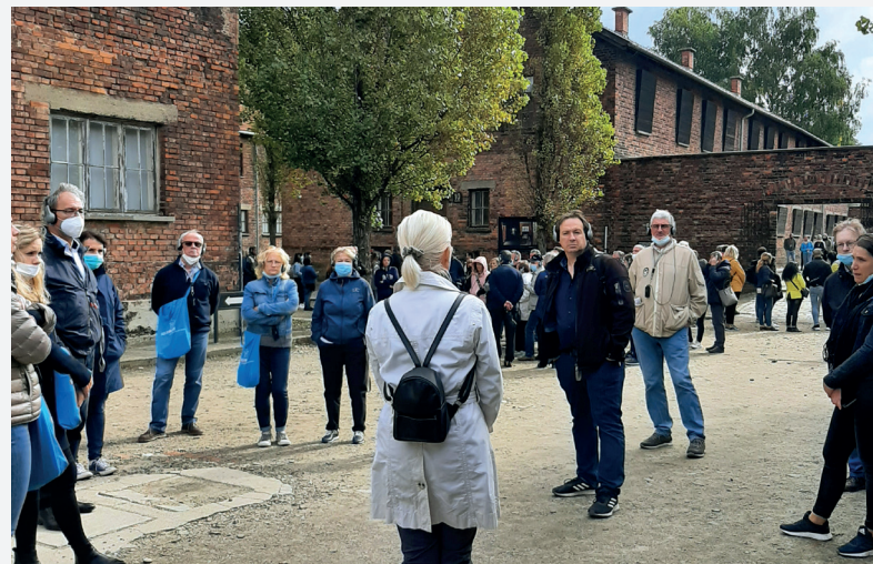
▲ Exkursion nach Auschwitz: Lehrkräfte besuchten mit dem Volksbund die Gedenkstätte.