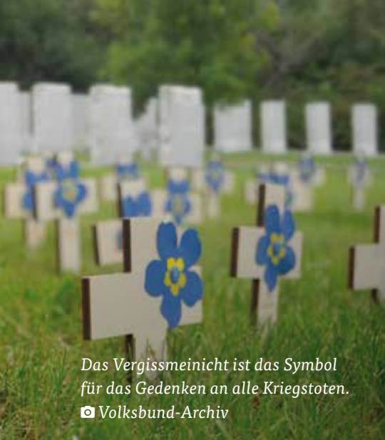
Das Vergissmeinnicht ist das Symbol für das Gedenken an alle Kriegstoten.