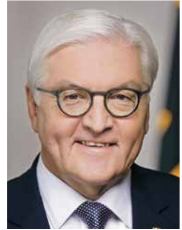
Bundespräsident Frank-Walter Steinmeier www.bundespraesident.de