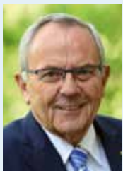
Wolfgang Schneiderhan Präsident

Wolfgang Schneiderhan Präsident des Volksbundes