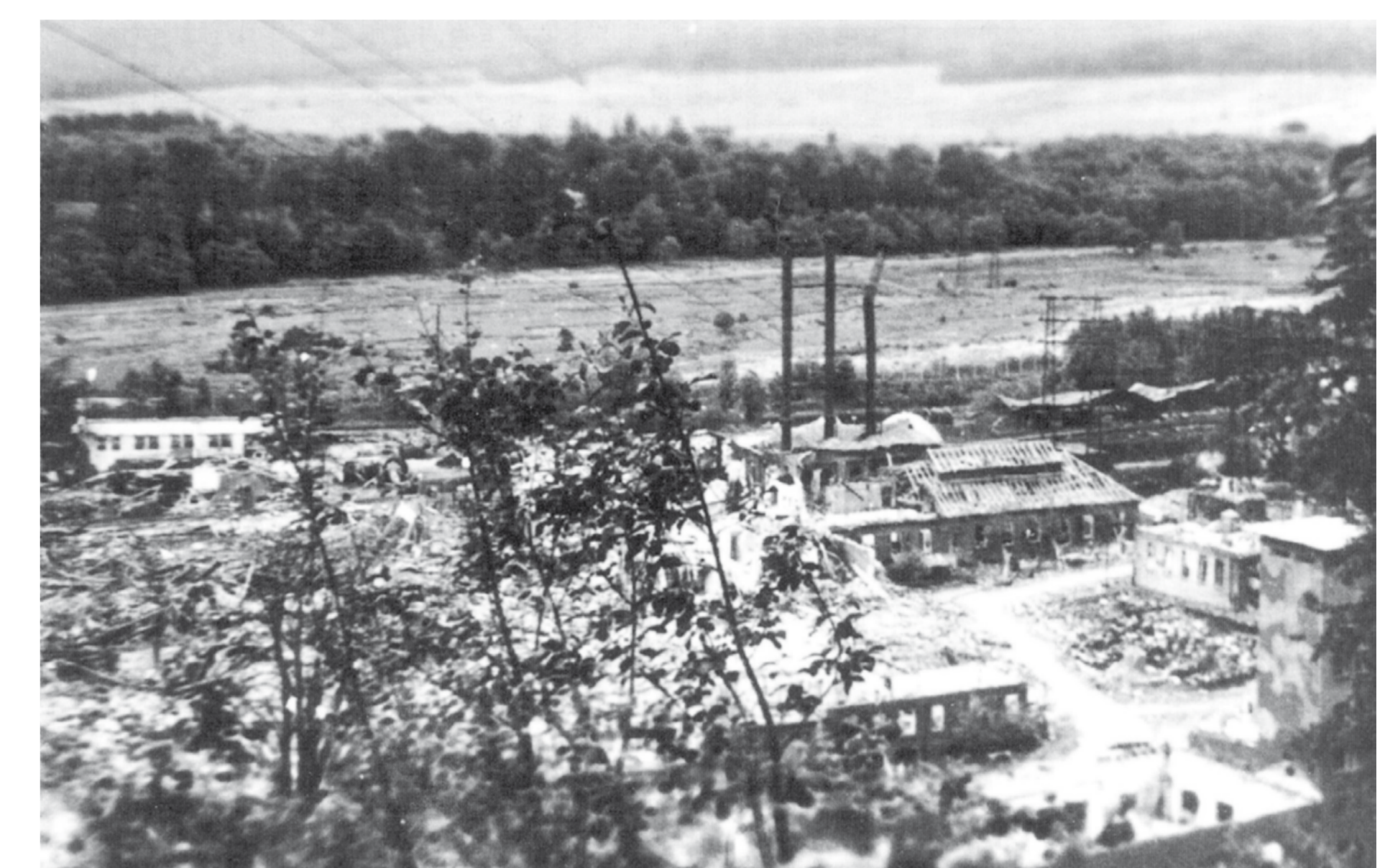
Die Sprengstofffabrik nach der Explosion im April 1945

Zeiten der Rüstungsproduktion genutzten Verbrennungsplatz lagerten sie weiterhin Abfallstoffe und Restmaterialien, die man dort verbrannte. Im November 1947 eröffnete der ehemalige Werksleiter der Munitionsfabrik im damaligen Wäschereigebäude die „Glashandelsgesellschaft mbH Fritz Hessinger.“