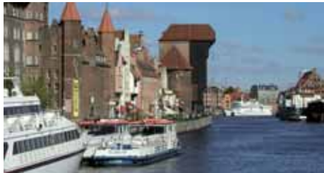
Das historische Krantor an der Mottlau in Danzig