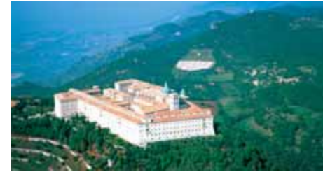
Kloster Monte Cassino