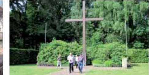
Hochkreuz Ehrenfriedhof Wilhelmshaven