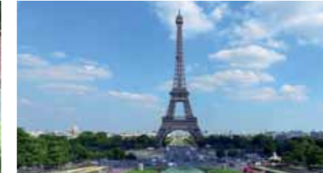
Paris mit Eiffelturm