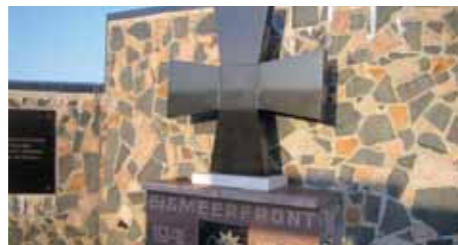
Der Friedhof Petschenga für die Toten der Eismeerfront