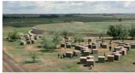
Kriegsgräberstätte Rossoschka in der Kalmückensteppe beim ehemaligen Stalingrad