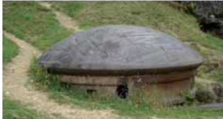
Turmhaubitze bei Verdun