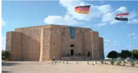
Deutsche Kriegsgräberstätte El Alamein