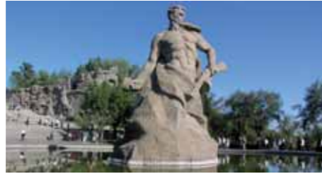
Der Mamajew-Hügel, die sowjetische Gedenkstätte in Wolgograd, dem ehemaligen Stalingrad