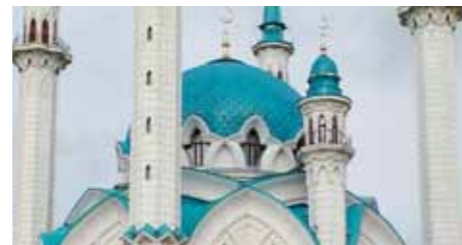
Kul-Scharif-Moschee Kazan Kreml