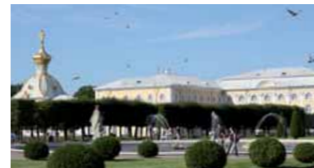
Die Parkanlage von Peterhof bietet eine Vielzahl prachtvoller Fontänen und Wasserspiele.