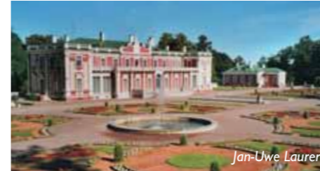
Schloss Kadriorg in Tallinn, Estland