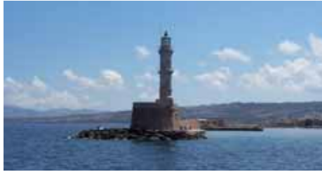
Hafen von Chanai auf Kreta