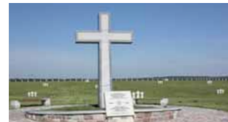
Die endlosen Weiten um Kursk – nach der Panzerschlacht 1943 ein Friedhof für Tausende