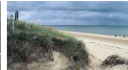
Aktivreise für Erwachsene an der französischen Atlantikküste