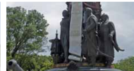
Krasnodar-Apscheronsk – der Sammelfriedhof für Gefallene im Kaukasusgebiet