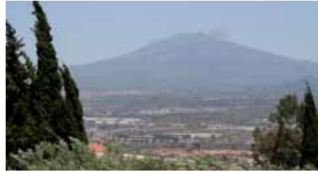
Blick auf den Ätna von der Kriegsgräberstätte aus