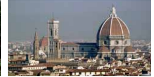
Kathedrale Santa Maria del Fiore in Florenz