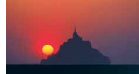
In der Nähe der Kriegsgräberstätte Mont-de-Huisnes