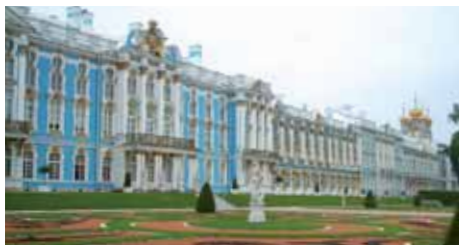
Der Katharinen-Palast, einstige Sommerresidenz der Zaren, in Puschkín bei St. Petersburg.