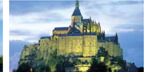
Der Mont St. Michel – Weltkulturerbestätte Frankreichs am Atlantik