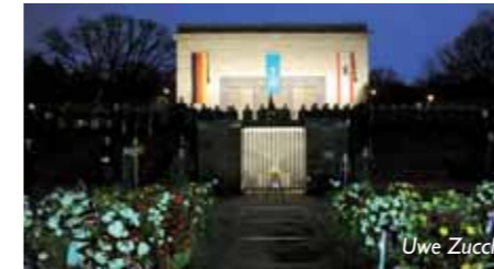
Kranzniederlegung Volkstrauertag Lilienthalstraße, Berlin