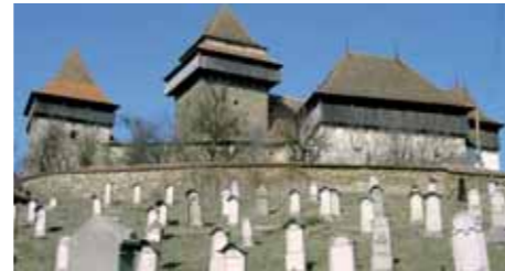
Brasov (Kronstadt) in Siebenbürgen