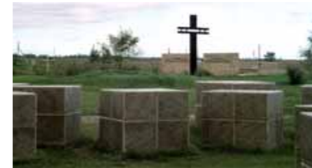
Kriegsgräberstätte Rossoschka in der Kalmückensteppe beim ehemaligen Stalingrad