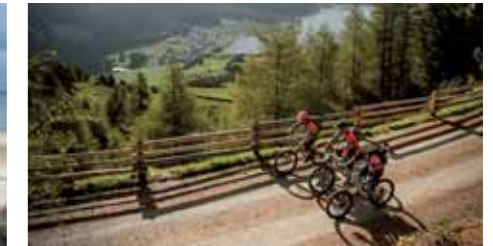
Mit dem Bike den Reschensee entlang