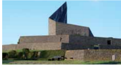
Das einzigartige Monument am Friedhof Futa Pass