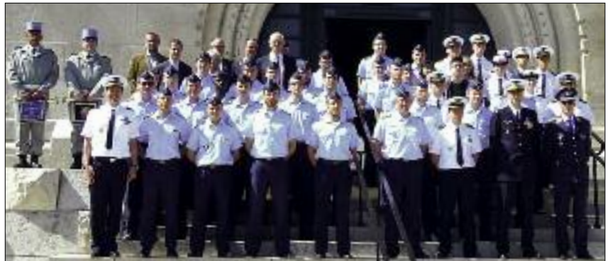
Deutsch-französische Delegation vor dem Beinhaus von Douaumont.

Seit 40 Jahren ist die Kriegsgräberreise mit der Offizierschule der Luftwaffe (OSLw), Fürstenfeldbruck, fester Bestandteil des Weiterbildungsrepertoires des Bezirksverbandes Oberbayern. Die Exkursion im Mai diesen Jahres stellte in mehrerer Hinsicht ein Novum dar: Gemeinsam besuchten deutsche und französische Offizieranwärter der OSLw und deren französischem Partner, der École de l'Air, neben den Gedenk- und Kriegsgräberstätten