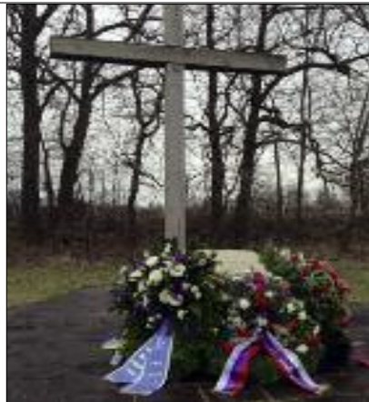
Kränze am Gedenkkreuz in Oberreit