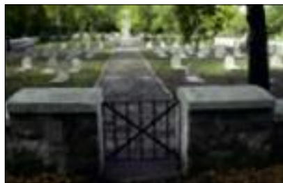
Foto: Deutsche Kriegsgräberstätte Sofia (Bulgarien), 278 Tote. Die Anlage im Sofioter Zentralfriedhof wird durch die Deutsche Botschaft betreut.

im Raum Verdun mit dem Hartmannsweilerkopf einen weiteren, so verlustreichen Brennpunkt des damaligen Kriegsgeschehens. Schulter an Schulter gedachte man der Gefallenen. Das Vorhaben wurde durch das Deutsch-Französische Jugendwerk (DFJW) gefördert. Vielen Dank, merci beaucoup an alle, die zum Gelingen dieses Leuchtturmprojektes, das in den nächsten Jahren fortgesetzt werden soll, beigetragen haben!