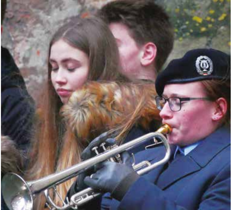
Landesfeier Hannover, 2017