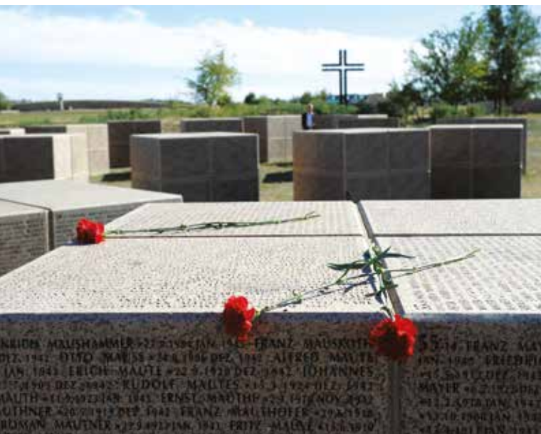
Deutscher Soldatenfriedhof, Wolgograd

Es ist „vorrangig Aufgabe der kommunalen Gremien und der örtlich tätigen Vereinigungen und Kirchen [...] auf eine Gestaltung hinzuwirken, die ein würdiges Gedenken an alle Opfer ermöglicht und nicht ausgrenzt“ (Niedersächsischer Landtag, Drucksache 17/7290). Dies bedeutet einer-