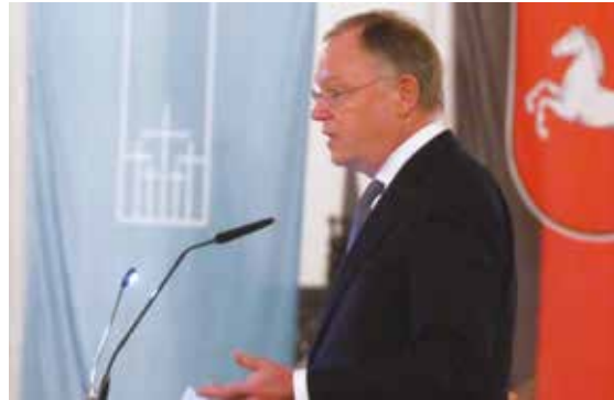
Ministerpräsident Weil, Landesfeier Verden, 2016

Gedenktage fallen, sofern sie gesetzliche Feiertage sind, in den Verantwortungsbereich der Kommunen; deren Umsetzung ist Sache des Rates und der Verwaltung und deren Gestaltung übernehmen auf Anfrage unterschiedliche Akteure. Daran sollte festgehalten werden.