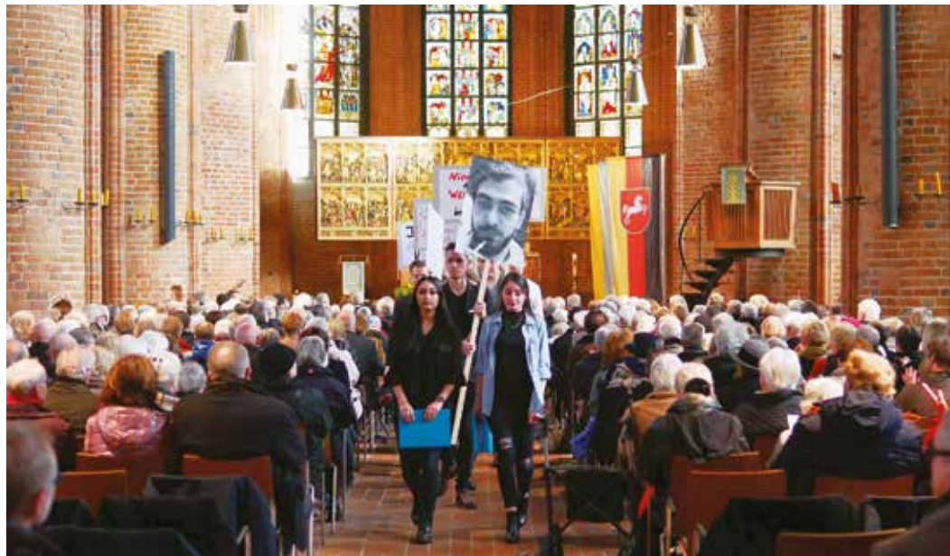
Volkstrauertag 2017, Marktkirche Hannover