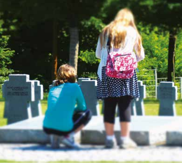
Jugend-Workcamp 2017, Kriegsgräberstätte Budaörs, Ungarn