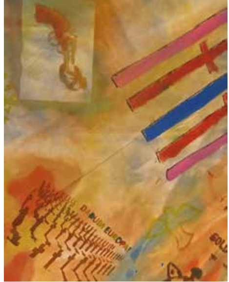
Fahne der Jugendgruppe „Projekt Frieden“, 2017

Insbesondere fördern wir die Verständigung zwischen Menschen aus ehemals verfeindeten Ländern an den Kriegsgräbern. Dabei erfahren wir seit Langem vielfach Versöhnung. Die internationale Arbeit verstehen wir auch künftig als Beitrag zu Frieden und Integration in Europa.