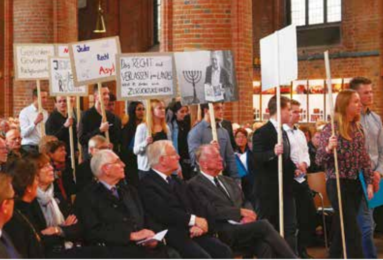
Landesfeier Hannover, 2017