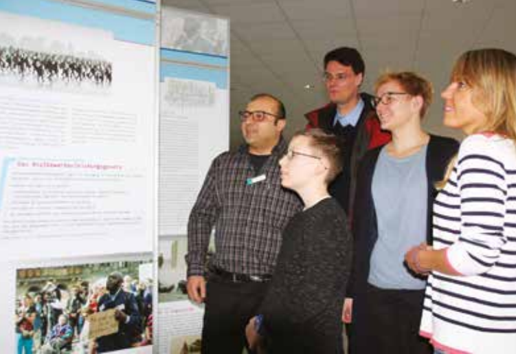
Schulausstellung, Barsinghausen, 2017

Schwerpunkte in Niedersachsen sind Geschichts- und Erinnerungstafeln und Namenszettel für unbekannte Tote, aber auch Pflegepatenschaften zu einem der 1.400 Kriegsgräberstädten auf dem Gebiet Niedersachsens.