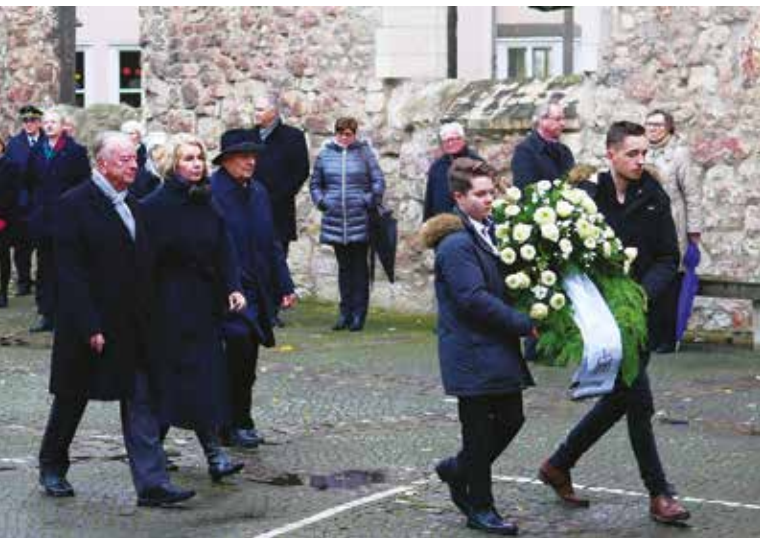
Kranzniederlegung Mahnmal Aegidienkirche, Hannover, 2017

(beschlossen auf dem Bundesvertretertag am 23. September 2016)