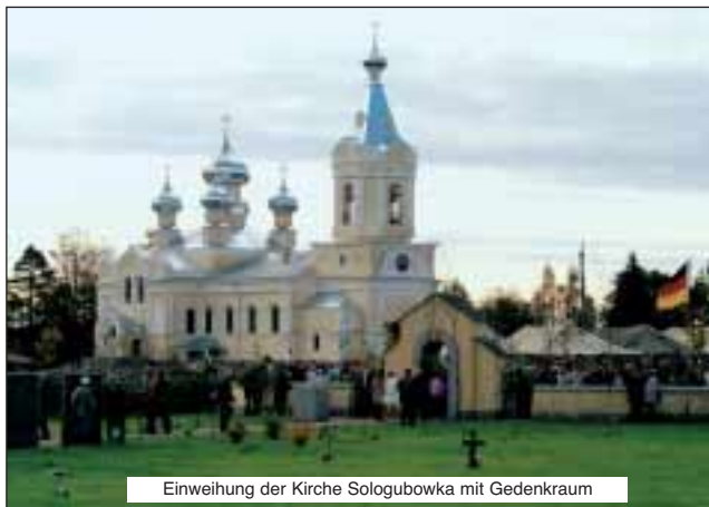
Einweihung der Kirche Sologubowka mit Gedenkraum