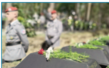
Einbettung in Halbe/Deutschland

24,6 Mio. Euro Stiftungskapital; seit 2001 unterstützte sie den Volksbund mit insgesamt 4 Mio. Euro, 2020: 300.000 Euro . www.gemeinschaftsgrabstaette.de: 100 Stifter haben mit einer Grabpflegeauflage für die Gemeinschaftsgrabstätten Berlin gestiftet.