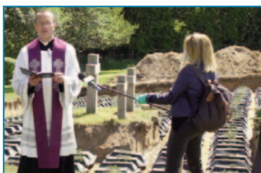
Stare Czarnowo/Polen: Worte und Gedanken an die Eingebetteten