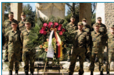
Reservisten in Pomezia/Italien