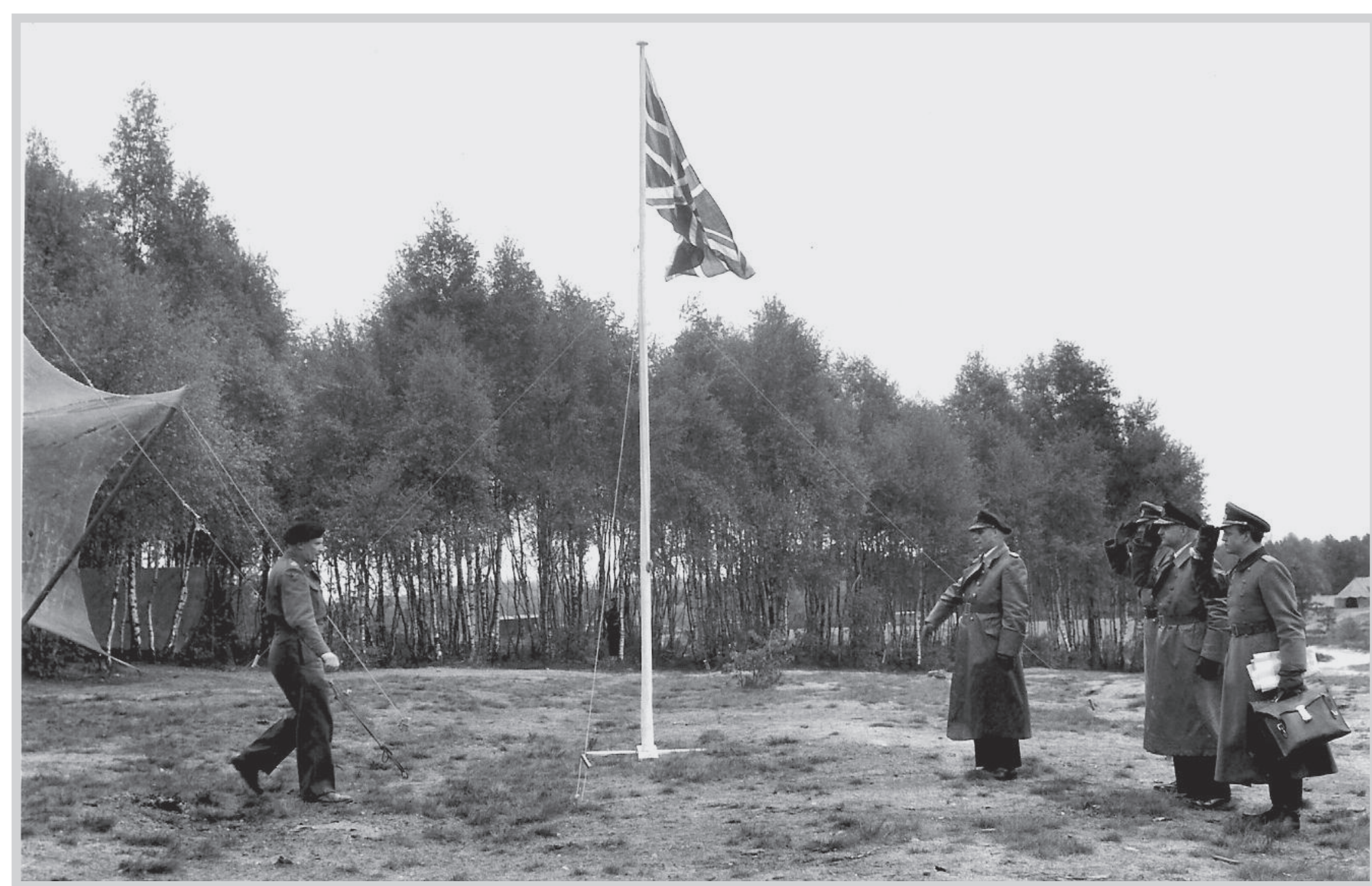
Feldmarschall Montgomery empfängt die deutsche Delegation auf dem Timeloberg unter der britischen Flagge. Field Marshal Montgomery receives the German delegation on the Timeloberg under the British Flag.