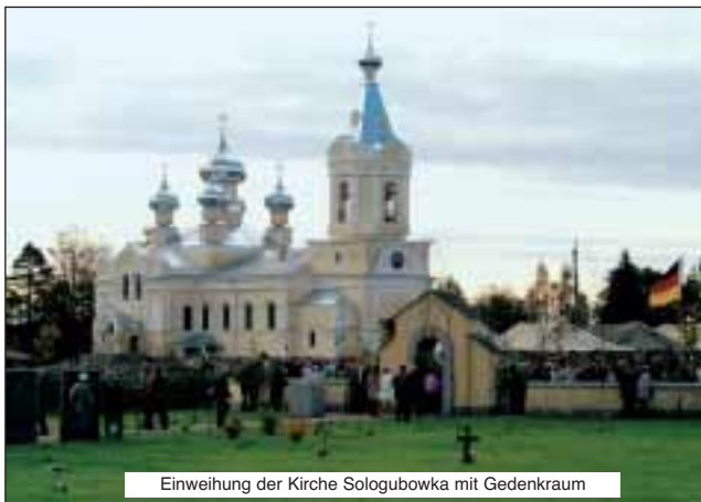
Einweihung der Kirche Sologubowka mit Gedenkraum