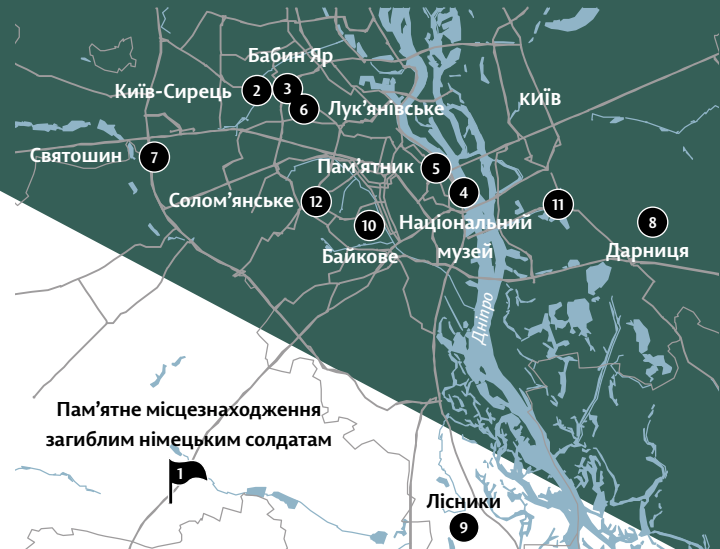
Пам'ятне місцезнаходження загиблим німецьким солдатам