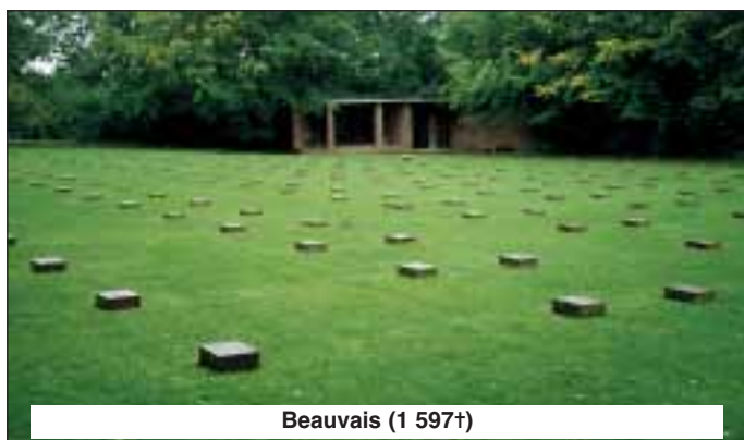
Beauvais (1 597+)

La forêt de Compiègne s'étend au Sud du parc du château. La Clairière de l'Armistice, où le maréchal Foch reçut les plénipotentiaires allemands dans son wagon salon le 8 novembre 1918 et où furent signées le 11 novembre les conditions de l'armistice, se trouve dans la partie Nord-Est de la forêt (à six kilomètres de Compiègne). C'est dans le wagon d'origine, qui fut détruit pendant la Deuxième guerre Mondiale, que fut signé également l'armistice franco-allemand de 1940. Une reconstitution du wagon salon est exposée dans un bâtiment en bordure de la clairière. Des contacts étroits existent depuis de nombreuses années entre la ville de Compiègne et l'association régionale du Volksbund pour le Land de Brême. Ces contacts s'établirent dès 1961, date à laquelle un camp de jeunes du Volksbund fut organisé pour la première fois à Compiègne, dans le but d'aider à l'entretien des cimetières militaires allemands.