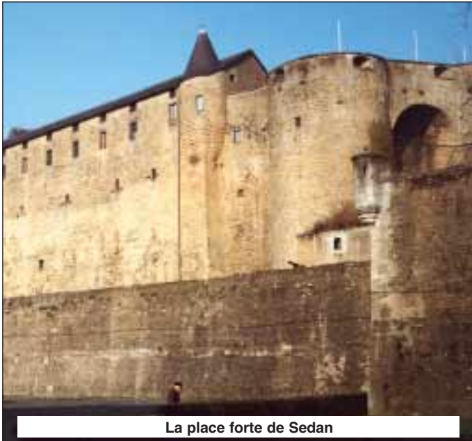
La place forte de Sedan