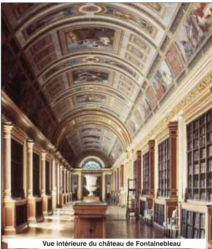
Vue intérieure du château de Fontainebleau

Outre le château, la ville propose également d'autres édifices à visiter. Au sud de la ville, la cathédrale St Louis qui date du XVIIIème siècle, au nord l'église Notre-Dame construite de 1684 à 1686 par Mansart et le Musée Lambinet qui expose des meubles, des peintures et des estampes de cette époque. Les Ecuries Royales, également construites par Mansart et qui pouvaient abriter 2.500 chevaux et 200 voitures, se situent sur le côté Est de la vaste Place d'Armes.