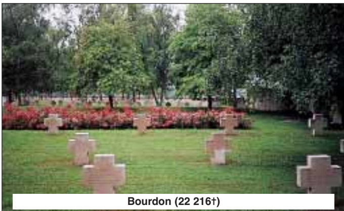
Bourdon (22 216†)

les troupes allemandes tentèrent d'avancer vers Paris en passant par la Belgique, afin d'éviter les fortifications de frontières françaises. De nombreux cimetières militaires de cette époque en témoignent. Les tranchées et les tracés du front sont encore visibles aujourd'hui.