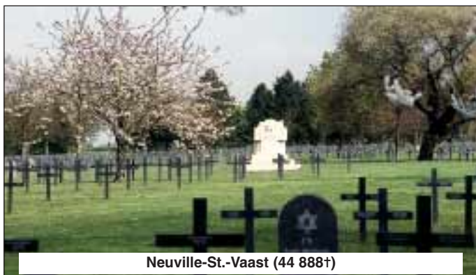
Neuville-St.-Vaast (44 888†)

Aujourd'hui encore, 100 ans après la fin de la Première guerre Mondiale, les cicatrices de la guerre sont encore décelables, comme c'est le cas, par exemple, dans la région du Vauquois et de la Butte de Montfaucon ainsi que dans les environs de Douaumont. Aujourd'hui encore, des ossements humains sont retrouvés lors de fouilles et de travaux entrepris dans cette ancienne région de combats pour recultiver le sol. Le Volksbund suppose que près de 20.000 soldats français et allemands ne purent être retrouvés lors des vastes travaux de nettoyage et de déblaiement qui eurent lieu jusque dans les années 1930 afin de débarrasser cet ancien champ de bataille entièrement retourné par des obus et des munitions qui en truf-