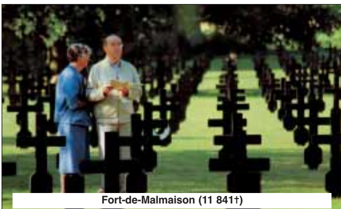
Fort-de-Malmaison (11 841†)

La cathédrale Notre-Dame à sept tours, qui date du XII ème /XIII ème siècle, mérite le détour. Elle compte parmi les églises de style premier gothique les plus importantes en France. D'autres grandes cathédrales furent construites sur son modèle. L'ancien Palais épiscopal, aujourd'hui Palais de Justice, qui présente les restes d'un cloître gothique, se situe derrière le chœur. Non loin de la cathédrale se dresse l'intéressant musée d'archéologie et d'histoire de l'art, dans le jardin duquel il est possible d'admirer une chapelle romane de l'ordre des Templiers avec coupole de style gothique.