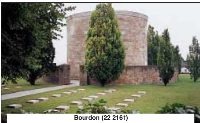
Bourdon (22 216†)

Pendant la Première guerre Mondiale, le secteur au nord de Bourdon fut le théâtre de violents combats. C'est là que