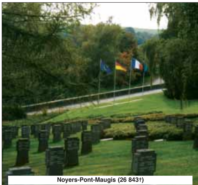
Noyers-Pont-Maugis (26 843+)

Pendant la Deuxième guerre Mondiale et plus particulièrement en 1940, de violents combats éclatèrent à nouveau dans la région de Sedan, lors de la percée des Ardennes et de la Ligne Maginot. Les victimes, inhumées au départ par les troupes en bordure de chemins ou dans des cimetières provisoires, furent exhumées dans les années 1940 à 1942 par le service des sépultures de l'Armée allemande et transférées sur une aire spéciale, attenante au cimetière de la Première guerre Mondiale. A la fin de la guerre, les Français y inhumèrent quelques soldats. A la date de la conclusion du traité franco-allemand de 1954 sur les sépultures de guerre, 4.880 soldats de la Deuxième guerre Mondiale y reposaient déjà. D'autres inhumations furent entreprises par le service d'exhumation du Volksbund.