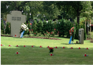
Kriegsgräberstätte Creußen (OFR). Hier ruhen 35 deutsche Gefallene des Zweiten Weltkrieges und ein russischer Kriegsgefangener des Ersten Weltkrieges.

Der Erlös der Gedenkerzen-Aktion "Lichter für den Frieden" - 2018 rd. 250.000 Euro - wurde bestimmungsgemäß wieder dafür verwendet, bei außerordentlichen Instandsetzungs- bzw. Pflegemaßnahmen auf Kriegsgräberstätten in Bayern finanziell zu unterstützen; so im vergangenen Jahr u.a. in: Oberelkofen und Puchheim (BVOBB) Straubing (BV NBY) Creußen u. Kulmbach (BV OFR) Markt Bibart (BV MFR) Hammelburg und Wildflecken (BV UFR) Bad Wörishofen (BV SCHW)