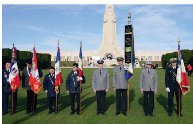
Deutsche und französische Fahnenabordnungen Seite an Seite vor dem Beinais von Douaumont.

Abordnungen aus Neumarkt-St. Veit, Reichertsheim und Schönberg (alle Landkreis Mühldorf a. Inn) sowie Markt Schwaben und Hohenlinden (beide Landkreis Ebersberg) waren auf den Tag genau 100 Jahre nach der Unterzeichnung des Waffenstillstands am 11. November 1918 zu Gedenkfeiern in Douaumont und Verdun eingeladen. Die 50 Personen umfassende Delegation, darunter sechs Schülerinnen des Franz-Marc-Gymnasiums aus Markt Schwaben, hatten bereits einen Tag zuvor die Wiedereinweihung der Mineur-Quelle (von der Bay. Mineurkompanie Nr. 1 erbaut) bei Saint Mihiel nach deren Renovierung mit ihren Fahnen feierlich umrahmt.