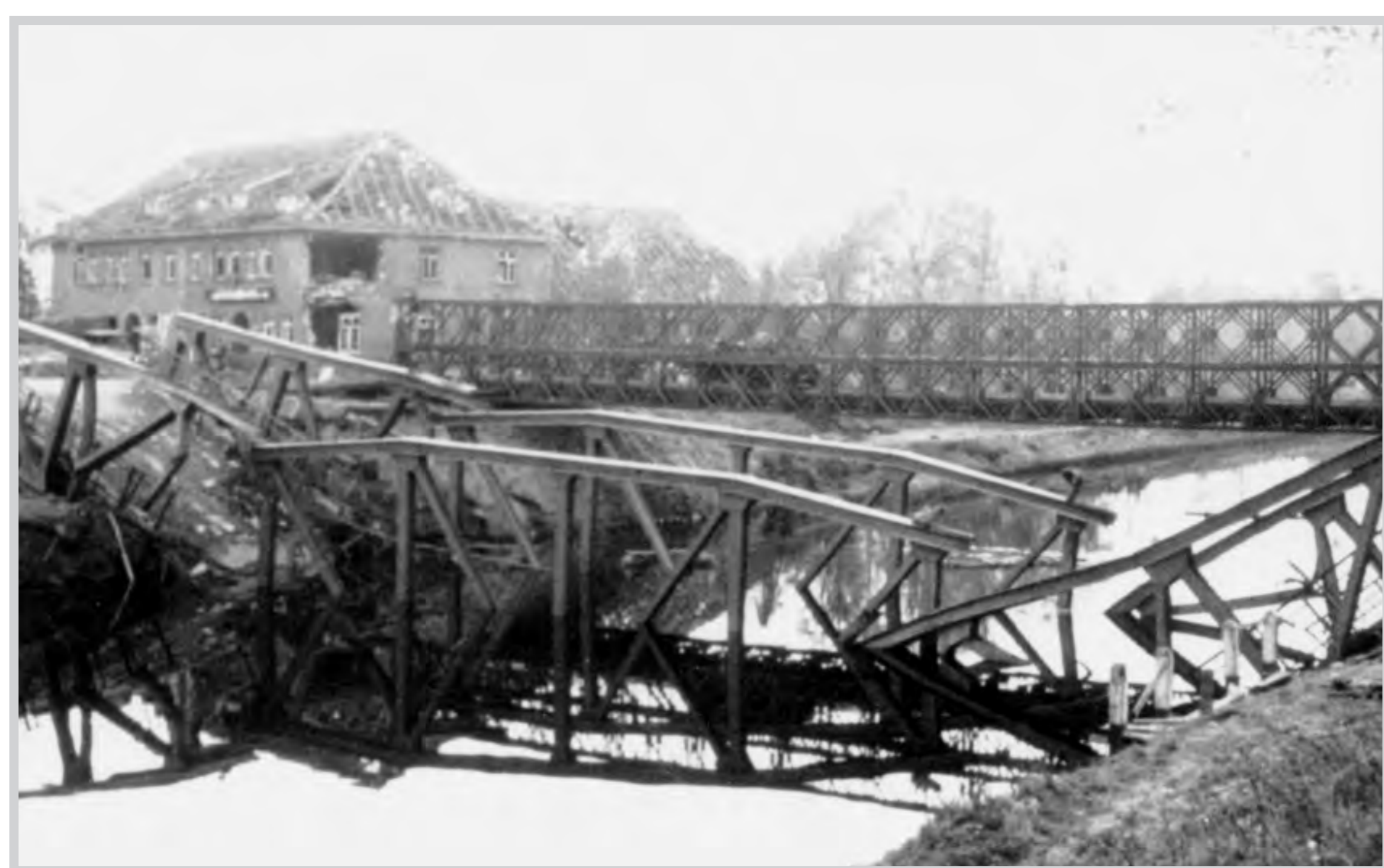
Zerstörte Kanalbrücke in Edewechterdamm. Im Hintergrund die von kanadischen Truppen errichtete Behelfsbrücke (sogen. Bailey-Brücke) und der Gasthof Duhme

Am 17. April gelingt den kanadischen Truppen der Übergang über den Küstenkanal und die Errichtung eines Brückenkopfes am Nordufer im Bereich Süddorf / Edewechterdamm. Die dortige Kanalbrücke ist zwei Tage zuvor von deutschen Truppen gesprengt worden, ebenso die anderen Übergänge auf Edewechter Gemeindegebiet in Husbäke und Jeddelloh II und zuletzt die Brücke bei Klein Scharrel am 20. April. Gegen den erbitterten Widerstand der deutschen Truppen behaupten die Kanadier den Brückenkopf und sichern ihn, nachdem eine Behelfsbrücke fertig gestellt wurde, bis zum 19. April endgültig. Am 20. April beginnen von hier aus die Angriffe in Richtung Edewecht und Osterscheps, am 21. April dann auch in ostwärtige Richtung entlang des Küstenkanals nach Husbäke. Im Edewechter Gemeindegebiet kommt es zu schweren