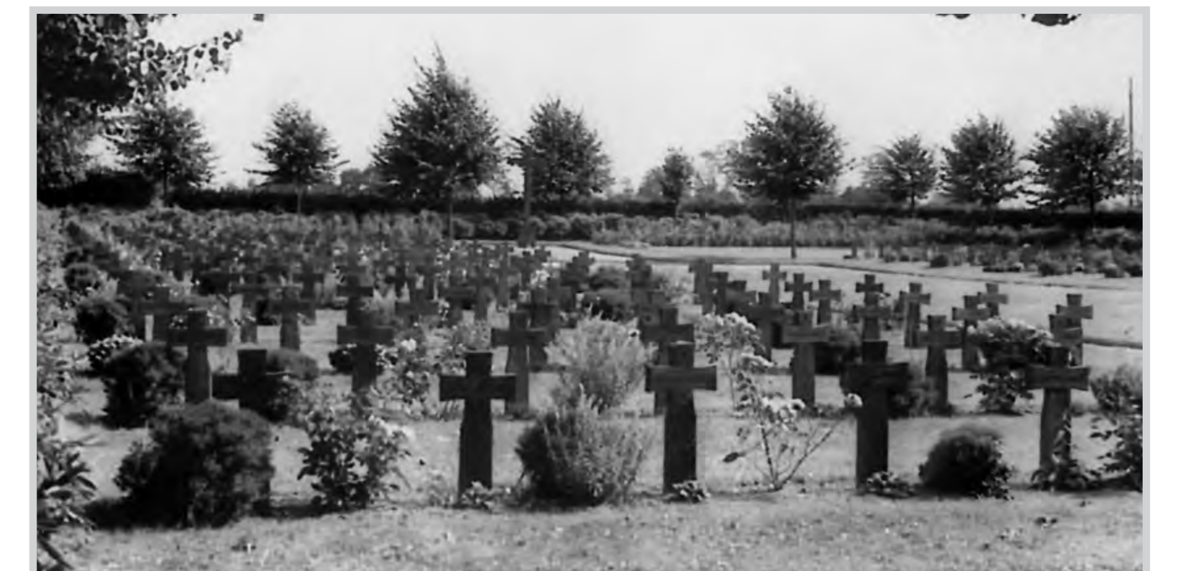
Blick auf den Ehrenfriedhof Anfang der 50er Jahr

Im Jahre 1964 wurde dieser Friedhof um ein örtliches Ehrenmal erweitert. Die bis dahin im Ort Edewecht existierenden einzelnen Denkmäler wurden aufgelöst und auf dem Ehrenfriedhof zusammengefasst. In eine Sandsteinmauer an der Westseite des Platzes fügte man die alten Ehrentafeln der früheren Kriege (1866, 1870 – 1871 und 1914 – 1918) ein. Zentrales Bauwerk des Ehrenmals ist ein 5 to. schwerer, flacher, auf einem Sockel ruhender Gedenkstein. Seine vier Seitenflächen tragen die Namen von 112 im 2. Weltkrieg aus dem Ort Edewecht Gefallenen. Auf dem Gedenkstein befindet sich das Gemeindewappen von Edewecht.