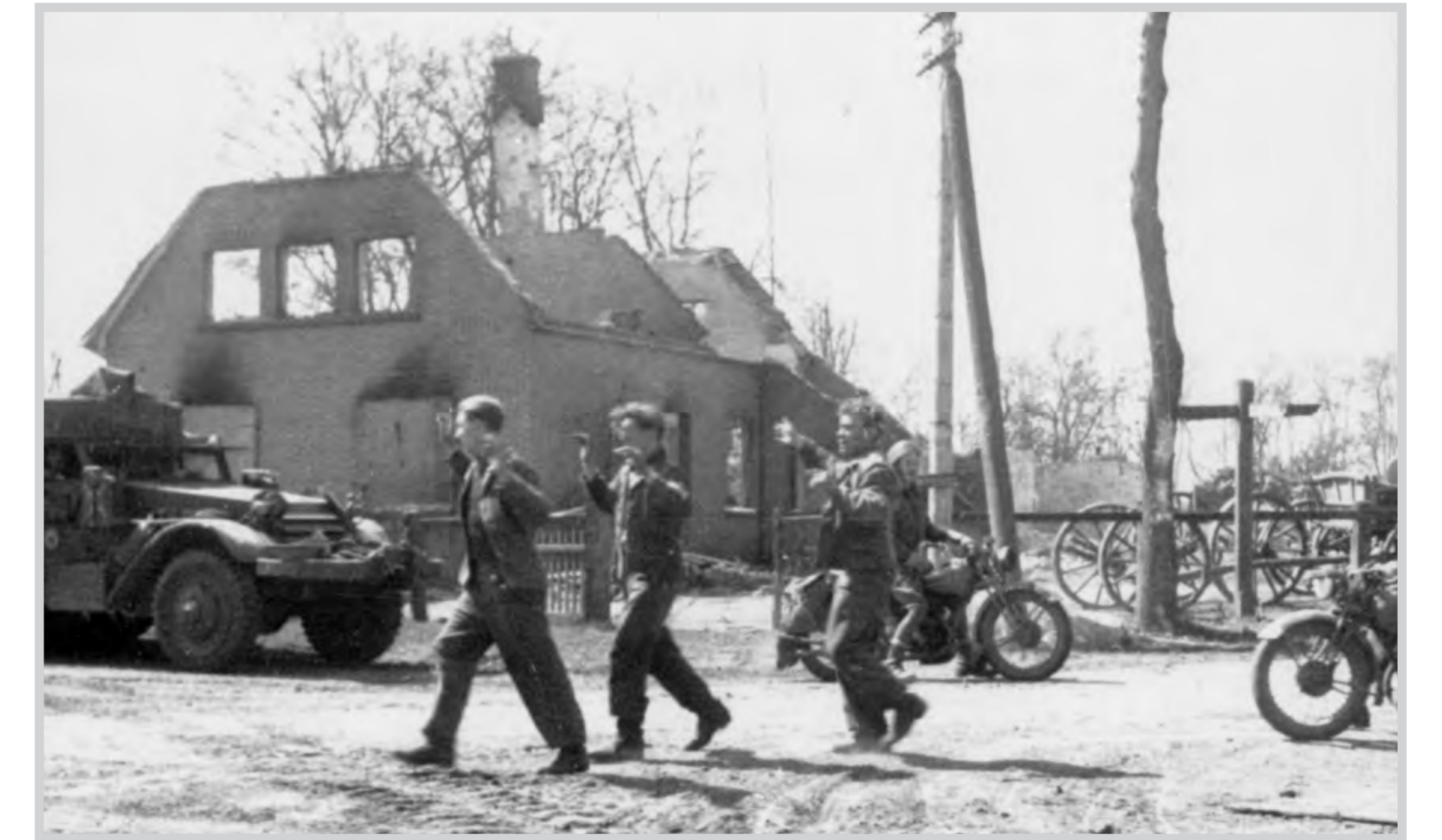
Sie haben die Kämpfe überlebt: Gefangennahme von 3 deutschen Soldaten in Osterscheps

gräbern die Toten geborgen. Davon werden 234 auf dieser Kriegsgräberstätte beigesetzt, einige wenige auch in Heimatorte überführt. In der Folgezeit werden auch aus den umliegenden Gemeinden Bösel, Altenoythe, Friesoythe, Barßel und Strücklingen tote Soldaten hierher umgebettet. Die letzte Umbettung erfolgte noch im Jahre 1976: Bei Straßenbauarbeiten in Osterscheps findet man die Gebeine von 3 Kriegstoten, die hier eine würdige Ruhestätte erhalten. Die kanadischen Toten ruhen heute u. a. auf einer zentralen Kriegsgräberstätte der Alliierten in Holten/Holland. Die getöteten deutschen Zivilopfer sind nach Kriegsende auf dem kirchlichen Friedhof beigesetzt worden.