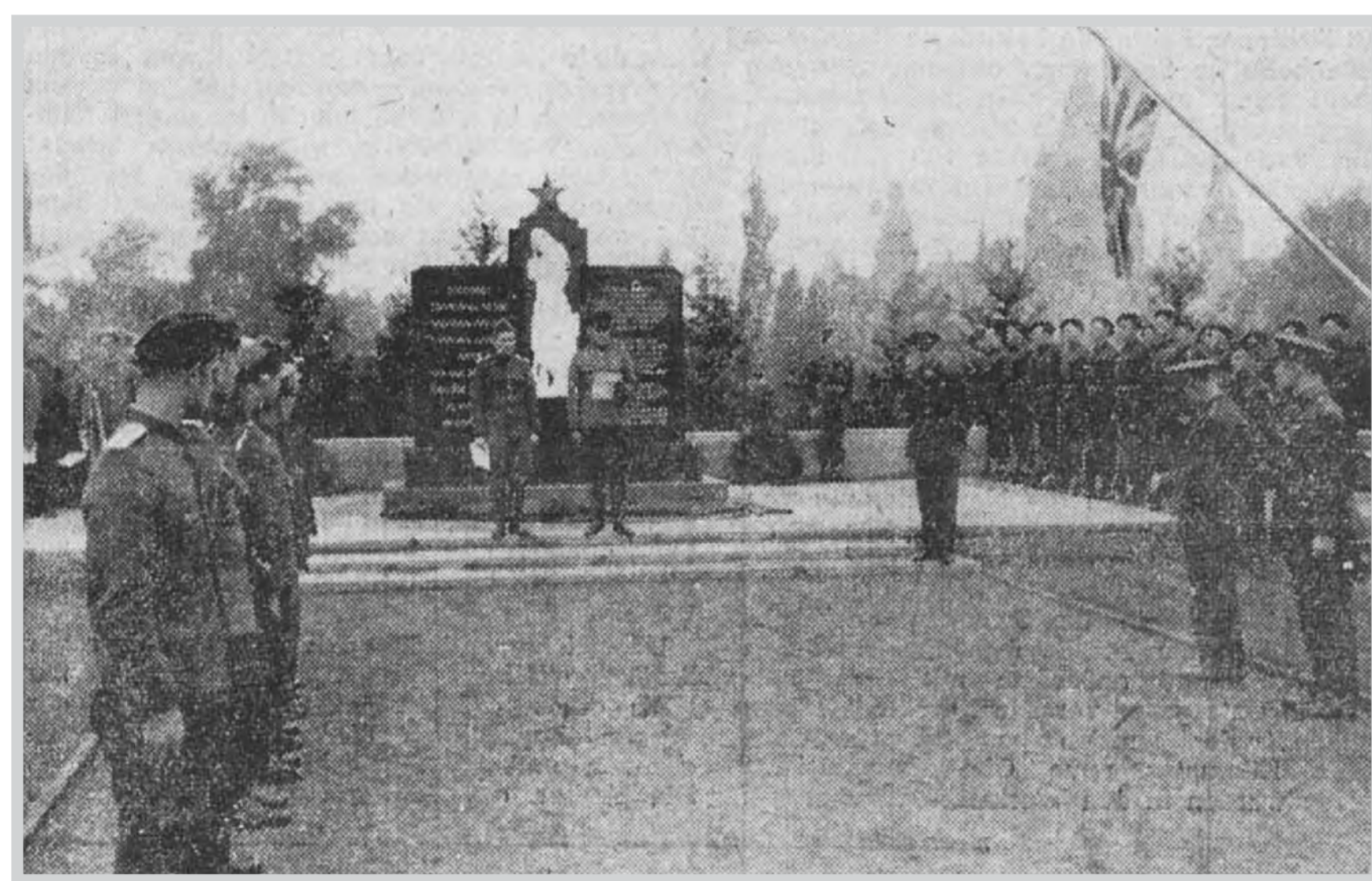
Einweihung des mit einem Sowjetstern bekrönten Mahnmals am 16. Oktober 1945.