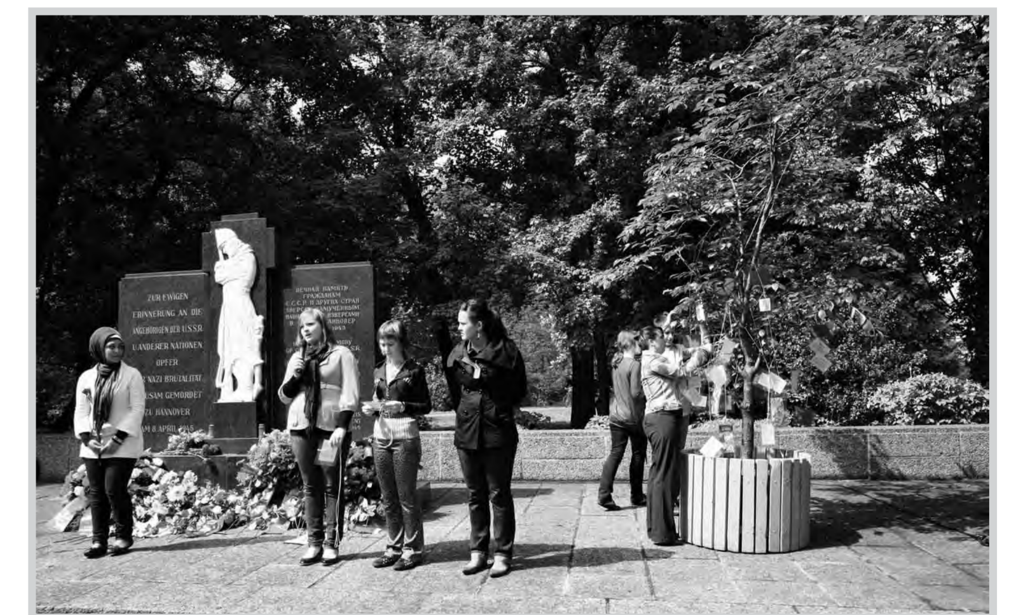
Feierliche Erinnerung am 8. Mai 2009 mit Schülerinnen und Schülern aus Mordowien/Russland und der Heinrich-Heine-Schule/Hannover.

Столица земли Нижняя Саксония г.Ганновер, 2010 г. Обер-бургомистр