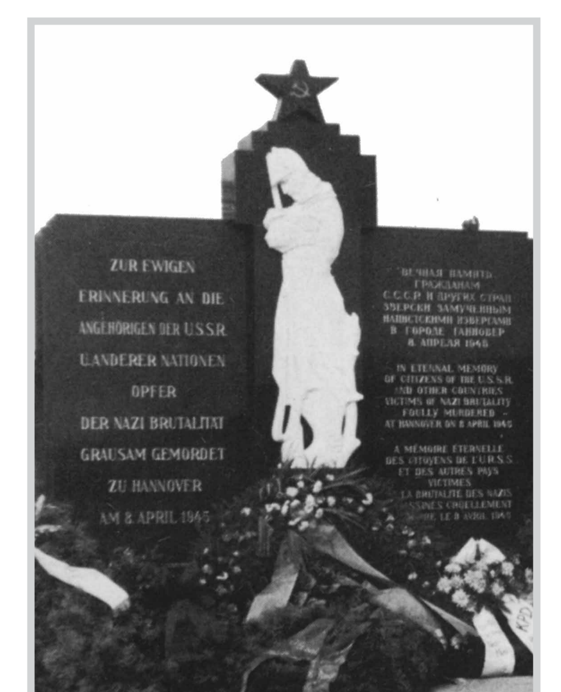
Denkmal Maschsee-Nordufer (Ausschnitt), 1947