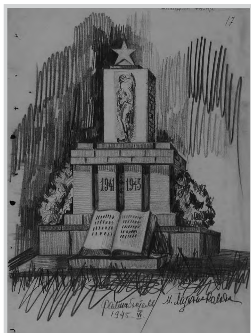
Zeichnung Muchins für das am 3. Juli 1945 eingeweihte Mahnmal auf dem sowjetischen Kriegsgefangenenfriedhof Oerbke.