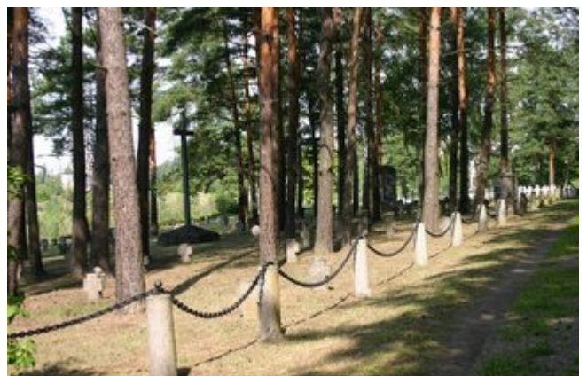
Deutscher Soldatenfriedhof 1914/18