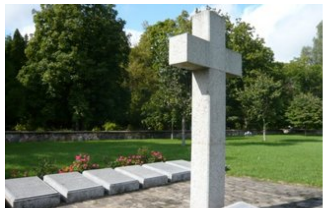
Deutscher Soldatenfriedhof 1939/45